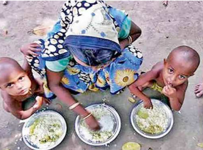
ગુજરાતમાં એક અંદાજ પ્રમાણમાં ઓછું વજન) છે. તેમને એ વાતે પણ ચોંકાવશે કે ન્યૂટ્રિશન રિહેબિલિટેશન સેન્ટરમાં બાળકોના