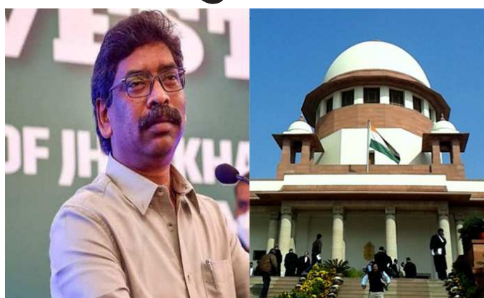
દીધા હતા. હેમંત સોરેનના વકીલને સુપ્રીમ કોર્ટે કહ્યું કે તેમને પહેલા હાઈકોર્ટ કેમ ના ગયા, સીધા સુપ્રીમ કોર્ટ આવી ગયા. જસ્ટિસ સંજીવ ખન્ના, જસ્ટિસ એમ.એમ.સુંદરેશ અને જસ્ટિસ બેલા એમ.ત્રિવેદીની બેન્ચે જેલમાં કેદ હેમંત સોરેનની

અરજી પર શુક્રવારે સવારે ૧૦.૩૦ વાગે સુનાવણી કરી. મની લોન્ડરિંગ મામલે ઈડી દ્વારા કરવામાં આવેલી ધરપકડ વિરુદ્ધ ઝારખંડના પૂર્વ મુખ્યમંત્રી અને ઝારખંડ મુક્તિ મોરચાના નેતા હેમંત સોરેને સુપ્રીમ કોર્ટમાં અરજી દાખલ કરી હતી. આ અરજી પર સુનાવણી માટે સુપ્રીમ કોર્ટ દ્વારા ગુરુવારે ૩ જજની એક વિશેષ બેન્ચની રચના કરવામાં આવી હતી. વિશેષ બેન્ચની રચના ચીફ જસ્ટિસ ડી.વાય.ચંદ્રચૂડ દ્વારા કરવામાં આવી.