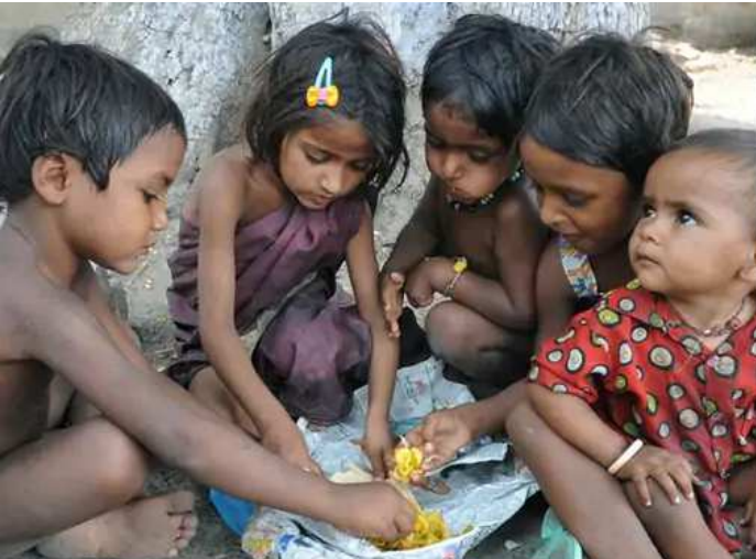
દાખલ થવાની સંખ્યા મામલે ગુજરાત ભારતમાં બીજા ક્રમે પહોંચી ગયું છે અને ઉપરથી આંકડો છેલ્લાં ત્રણ વર્ષમાં બમણો થઈ ગયો છે, જે મોટી ચિંતાનો વિષય છે. ત્યારે એની અસર ગુજરાતના બજેટ

પર પણ જોવા મળી રહી છે. આ વખતેના બજેટમાં સુપોષિત ગુજરાત મિશનની જાહેરાત કરાઈ છે અને પોષણલક્ષી યોજનાઓમાં નોંધપાત્ર વધારો કરવામાં આવ્યો છે. ચાલુ વર્ષની અંદાજે ૩૨૦૦ કરોડની જોગવાઈ સામે આગામી વર્ષ માટે ૫૫૦૦ કરોડની જોગવાઈ કરવામાં આવી છે, એટલે કે આ યોજનાઓ માટે ૨૩૦૦ કરોડનો વધારો કરવામાં આવ્યો છે. વર્લ્ડ હેલ્થ ઓર્ગેનાઈઝેશન (ઉચ્છૈ) કુપોષણને વિશ્વના જાહેર આરોગ્ય માટે એક ગંભીર ચેતવણી માને છે. આમ તો સરકાર કુપોષણ માટે ઘણા પૈસા ખર્ચતી હોય છે અને ઘણા પ્રોગ્રામ્સ ચલાવતી હોય છે. એમ છતાં ગુજરાતમાં કુપોષણની સ્થિતિ