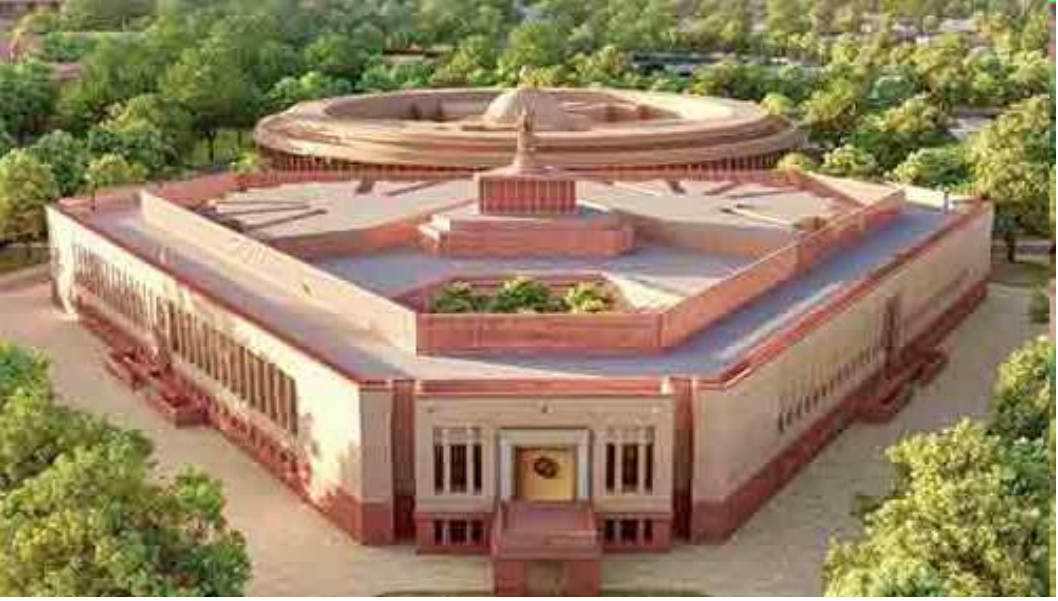
નવીદિલ્હી,તા.૩૦ લોકસભા ચૂંટણીનું કાઉન્ટડાઉન શરૂ થઈ ગયું છે. બીજા કાર્યકાળનું સંસદનું અંતિમ સત્રનો પ્રારંભ થશે. લોકસભામાં

વોટ ઓન એકાઉન્ટ પાસ કરવા ઉપરાંત આ સત્રમાં અનેક મહત્વપૂર્ણ કાર્યકાર્યો થશે. જો કેદરેકલોકસભાતેનાદરેકકાર્યકાળ માટે અલગ-અલગ કારણોથી જાણીતી છે, પરંતુ વર્તમાન ૧૭મી લોકસભામાં કેટલીક એવી ઘટનાઓ બની છે જેની ચર્ચા દાયકાઓ સુધી થતી રહેશે.