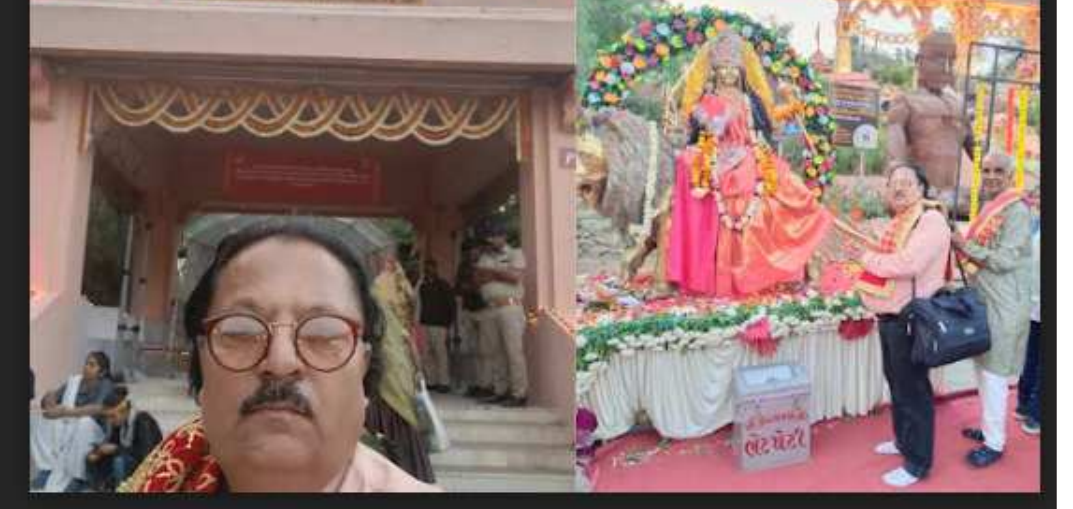
૫૧ શક્તિપીઠ પરિક્રમા મહોત્સવ ૧૬/૨ થી ૨૨/૨..અંબાજી ખાતે આજે ગુલ રાજ્યમંત્રી હર્ષ સંઘવી ની આગેવાનીમાં મોટાભાગના ધારાસભ્યો અને પ્રિન્ટ ઈલેક્ટ્રોનિક મીડિયા ના પત્રકારો આજરોજ લઈ જવામાં આવ્યા. ગુજરાતી યાત્રાધામ વિકાસ બોર્ડના ચેરમેન શ્રી આર આર રાવલ સાહેબ અંબાજી ખાતે ગુલ ખાતા ના સહકારથી ખૂબ મોટા પાયે સુંદર વીઆઈપી સગવડો ઊભી કરવામાં આવી હતી અને મહા આરતી પણ ખુબ જ સારી રીતે અને શાંત પૂર્ણ રીતે થઈ હતી. ગબ્બર ને પૂર્ણ રીતે ૫૧ શક્તિપીઠ લાખો દીવાઓ સાથે શણગારવામાં આવ્યો હતો...મુખ્યમંત્રી પણ તમામ ધારાસભ્યો અથે ઉડાન ખટોલા માં ગબ્બર ઉપર જઈ ને મહા આરતી માં જોડાયા હતા.