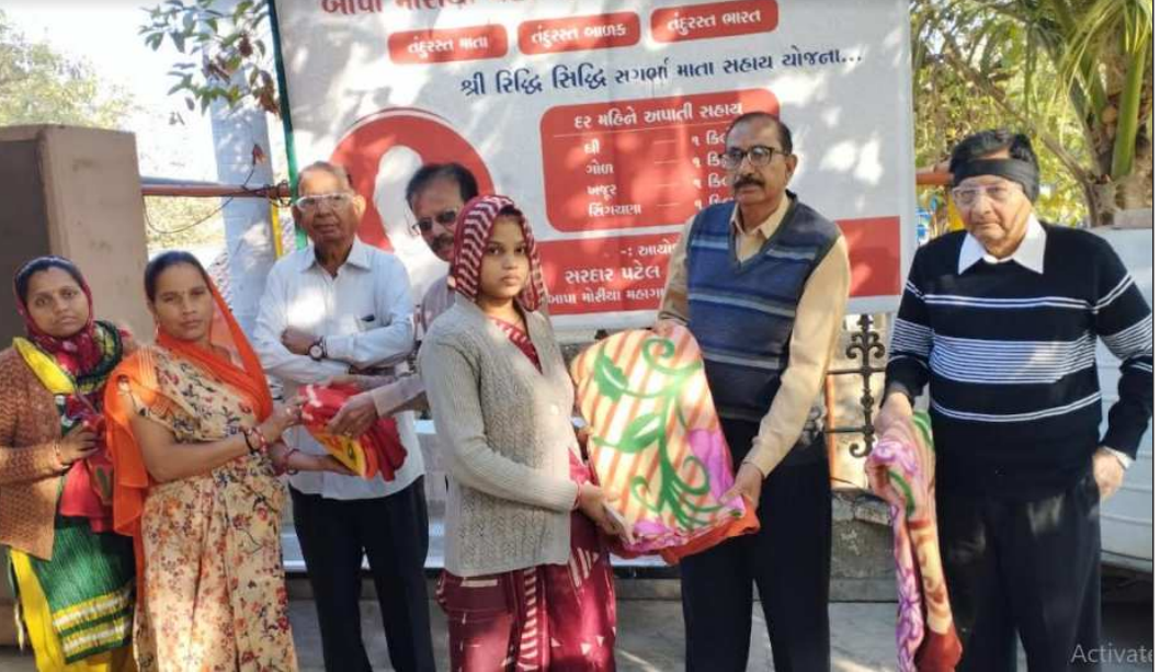
વસ્ત્રાપુર મા સરદાર પટેલ સેવાદળ દ્વારા જરૂરયાત ગર્ભવતી બહેનો ને અનાજ કદોળ ગોળ તથા જરૂરી ખાદ્ય સામગ્રી ની કીટ વિતરણ કરવામાં આવી હતી