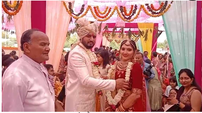
ચાણસમા તાલુકાના મંડલોપ ગામે આવેલ પ્રાથમિક શાળા ના સંકુલ ખાતે પાટણવાડા ઔદ્યોગ સહસ્ત્ર બ્રાહ્મણ સમાજ ના

સમુહલગ્ન યોજાયા હતા જેમાં ૧૧ નવદંપતિઓએ શાસ્ત્રોક્ત વિધિથી પ્રભુતાના પગલા માંડ્યા હતા તેમજ ૫૩ બટુકોએ યજ્ઞોપવિત સંસ્કાર ધારણ કરી હતી ચાણસમા તાલુકાના મંડલોપ ગામે આવેલ પ્રાથમિક શાળા ના સંકુલ ખાતે પાટણવાડા ઔદ્યોગ સહસ્ત્ર બ્રહ્મ સમાજના સમુહલગ્ન યોજાયા હતા જેમાં મોટી સંખ્યામાં સમાજના આગેવાનો તેમજ લોકો દ્વારા હાજર રહી નવદંપતિઓને આશીર્વાદ