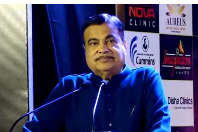
આવવાના સવાલ પર ભારતમાં અમેરિકી વાહન ગડકરીએ કહ્યું કે, સરકાર ઉત્પાદકોના સ્વાગત માટે તૈયાર છે,

તા. ૧૮ કેન્દ્રીય માર્ગ પરિવહન અને રાજમાર્ગ મંત્રી નીતિન ગડકરીએ જણાવ્યું છે, ડ્રાઈવરોની રોજગારની ચિંતાને ધ્યાનમાં રાખી તેમની રક્ષા માટે ભારતમાં ડ્રાઈવરલેસ કારો નહીં આવે. એક રિપોર્ટમાં ગડકરીએ કહ્યું કે, x ક્વારેય પણ ડ્રાઈવરલેસ કારોને ભારતમાં લાવવા માટે મંજૂરી નહીં આપું, કારણ કે તેનાથી કેટલાય ડ્રાઈવરોની નોકરી જતી રહેશે, એટલે હું એવું નહીં થવા દઉં. x નાગપુરમાં યોજાયેલ જીરો માઈલ સંવાદ દરમ્યાન દેશમાં માર્ગ સુરક્ષા સંબંધી ચિંતાઓ પર સંબોધન કરતાં ગડકરીએ કહ્યું કે, દુર્ઘટનાઓ ઓછી કરવા માટે સરકારી ઉપાયો માટે ફેમવર્ક તૈયાર કર્યું છે, જેમાં કારોમાં છ એરબેગ સામેલ કરવી, માર્ગ પર બ્લેક સ્પોટને ઓછા કરવા અને ઈલેક્ટ્રિક મોટર્સ અધિનિયમ દ્વારા દંડ વધારવા વગેરે પ્રક્રિયા સમાવેશ થાય છે. ટેસ્લા ઈન્કને ભારતમાં