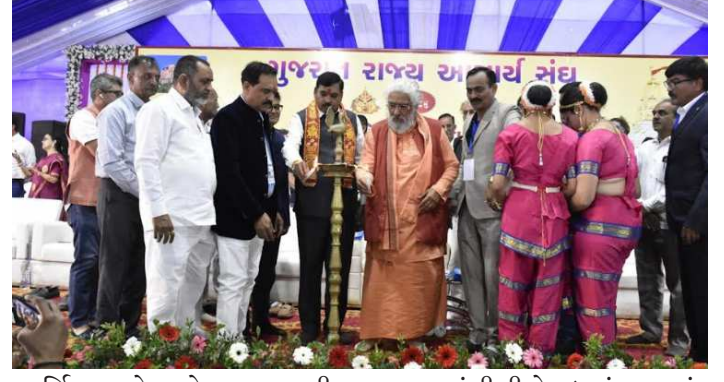
સર્વિસમા સેવાનો ભાવ રાખી ફરજ નિભાવવા જણાવ્યું હતું.

ગિંચાઈઓ સિધ્ધ કરી રહ્યું છે. ૨૦૪૭ સુધી વિકસિત ભારત બનાવવા માટે આપણે બધાએ સાથે રહી એક બીજાના સહયોગથી આગળ વધવું પડશે. સરકાર સમાજના દરેક વ્યક્તિ માટે યોજનાઓ ધરે છે. સમાજમાં રહેલા દુષણોને મૂળમાંથી ઉપાડી ફેંકવામાં શિક્ષકો બહુ જ મહત્વનું યોગદાન આપી શકે છે. મંત્રીશ્રીએ આચાર્યશ્રીઓને