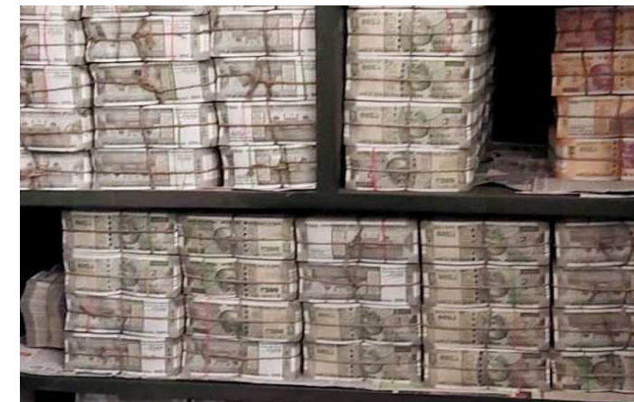
રોકડ રકમ મળી આવી હતી. ઈન્કમેક્સ ડિપાર્ટમેન્ટના આ દરોડામાં

ઈન્કમ ટેક્સ ડિપાર્ટમેન્ટે ભુવનેશ્વરના રોજ બૌધ ડિસ્ટ્રિબ્યુટી પ્રાઇવેટ લિમિટેડ પર મોટી કાર્યવાહી કરતાં તેના અનેક ડેકાણા દરોડા પાડ્યા હતા. આઈટી વિભાગે કંપનીની ઓડિશા અને ઝારખંડમાં આવેલ ઓફિસમાં કાર્યવાહી કરી હતી. ઈન્કમ ટેક્સ વિભાગે કરચોરીની શંકાના આધારે બૌધ ડિસ્ટ્રિબ્યુટી પ્રાઇવેટ લિમિટેડ વિરુદ્ધ આ કાર્યવાહી કરી છે. આ દરોડા દરમિયાન વિભાગને એટલી નોંધે મળી હતી કે તેને ગણતા-ગણતા મશીન પણ કબજે કરી હતું. આ દરોડા દરમિયાન આઈટી વિભાગને ૫૦ કરોડથી વધારે