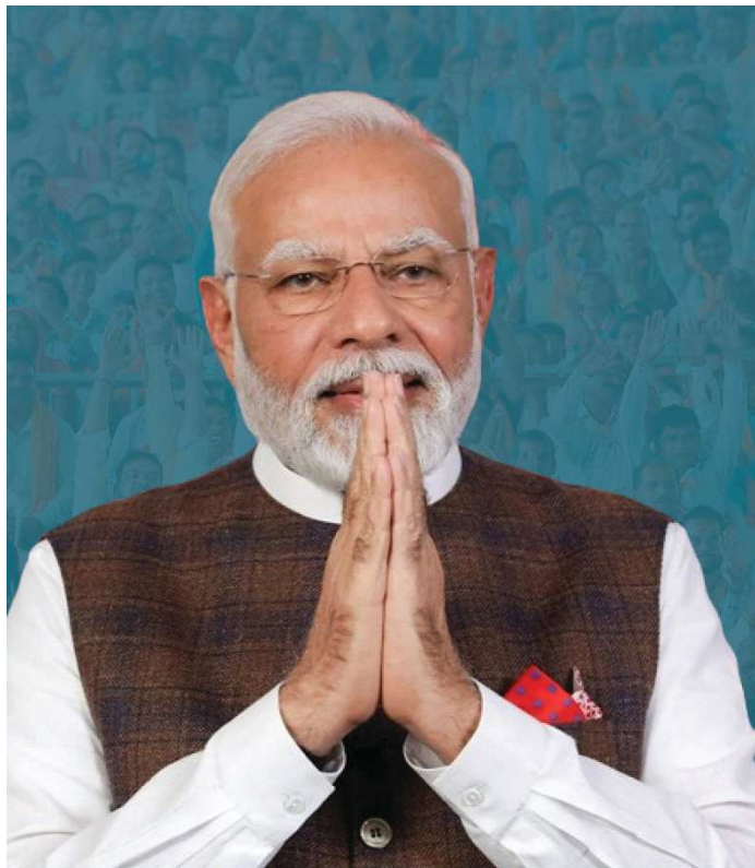
નવી દિલ્હી, તા.૦૭ મધ્યપ્રદેશ, છત્તીસગઢ અને દેશમાં ૩ રાજ્યો રાજસ્થાનમાં ભાજપની પ્રચંડ

જીત બાદ આજે સંસદ ભવનમાં ભાજપ સંસદીય દળ (મૉટ્ટો કૉલેક્ટીવ ડેવલપમેન્ટ)ની બેઠક યોજાઈ હતી. બેઠકમાં ત્રણેય રાજ્યોમાં જીત બદલ વડાપ્રધાન નરેન્દ્ર મોદી (સ્ક્રીન ડિસ્પ્લે સ્ક્રીન)ને અભિનંદન પાઠવાયા હતા. બેઠકમાં વડાપ્રધાન મોદીએ કહ્યું કે, આ જીત માત્ર મોદીની નથી, પરંતુ તમામ કાર્યકર્તાઓની સામુદાયિક જીત છે. આ દરમિયાન પીએમ મોદીએ તમામ સાંસદોને પોત-પોતાના મતવિસ્તારમાં જઈને લાભાર્થીઓનો સંપર્ક કરવા, લોકો સુધી સરકારી યોજાનાની માહિતી પહોંચાડવા તેમજ લોકસભામાં ચૂંટણી માટે કમર કસી લેવા અપીલ કરી હતી.