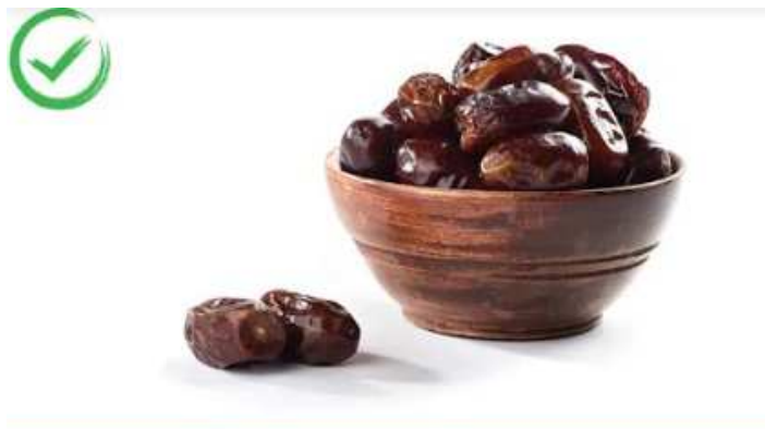
માંસાહારી ઈંડાને બદલે પૌષ્ટિક ખજૂર ખાવ