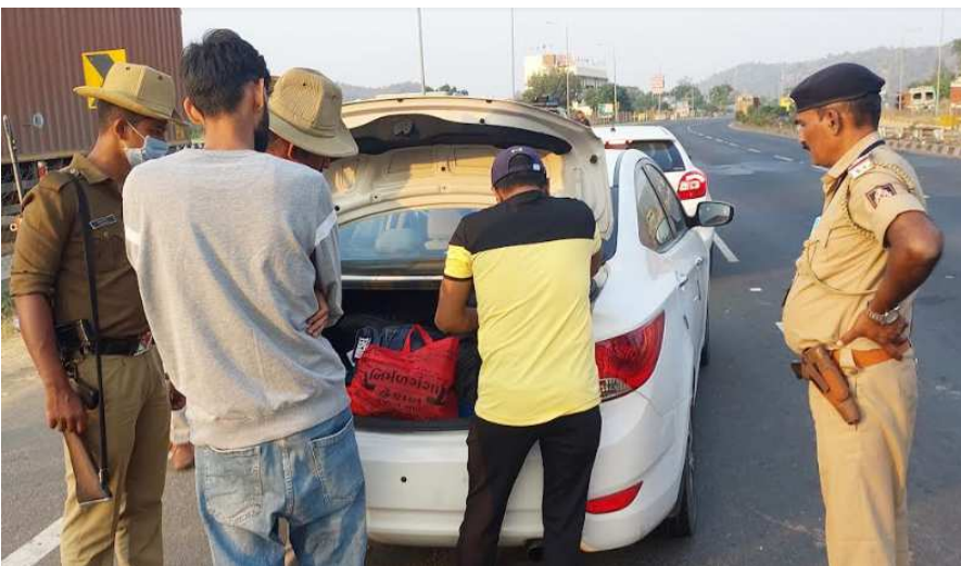
રાજસ્થાનમાં વિધાનસભા ચૂંટણી હોવાથી રાજસ્થાન ની રતનપુર બોર્ડર પર ગુજરાત તરફ થી આવતા નાનાં મોટાં વાહનો ને રોકી સી આર પી જવાનો ચેકીંગ કરી ને વાહનો આગળ જવા દેતાં હતાં પોલીસ બંદોબસ્ત ની સાથે ચૂંટણી પંચ નાં અધિકારીઓ પણ ચેકીંગ કરતાં હતાં