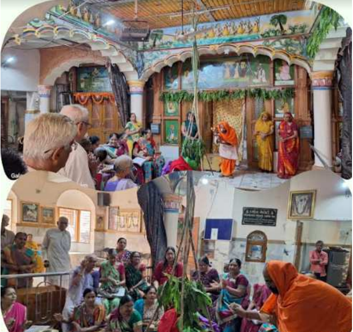
મોડાસા ના સુપ્રસિદ્ધ શ્રી ગોકુલનાથજી મંદિર ખાતે ના ૨૩-૧૧-૨૩ ગુરુવાર કારતક સુદ - ૧૧ પ્રબોધિની એકાદશી ઉત્સવ પર્વ મંડપ દર્શન - તુલસી વિવાહ દર્શન મંદિર ખાતે સવારે ૧૦ વાગે યોજવામાં આવેલ હતા. તુલસી