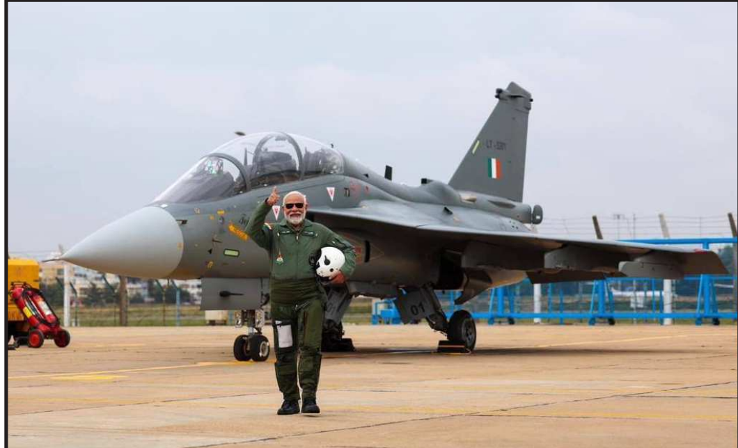
માનનીય પ્રધાનમંત્રી શ્રી @narendramodi સાહેબે આજે હિન્દુસ્તાન એરોનોટિક્સ લિમિટેડની મુલાકાત દરમિયાન તેજસ ફાઇટરમાં ઉડાન ભરીપઆપણાં સમગ્ર દેશ માટે આ પળ ઐતિહાસિક પળ છે. તેજસને હિન્દુસ્તાન એરોનોટિક્સ લિમિટેડ (એઇએન) દ્વારા વિકસાવવામાં આવ્યું છે. તે સિંગલ એન્જિન વાઈટ ફાઇટર એરક્રાફ્ટ છે. એરકોર્સમાં તેના બે સ્કવોડ્રનને સામેલ કરવામાં આવ્યા છે.

મુંબઈ શહેરના એક બગીચામાં પપ્પા બાંકડા પર બેઠાં હતાં ત્યાં રડતી રડતી તેમની નાની દીકરી તેમની પાસે આવી કહે, મારી ઠીંગલી ખોવાઈ ગઈ છે. પપ્પાએ તેને આશ્વાસન આપ્યું અને કહ્યું, ઠીંગલી મળી જશે. બગીચામાં ઠીંગલીની શોધ શરૂ કરી, બંનેએ મહેનત કરી છતાં ઠીંગલી શોધવામાં અસફળ રહ્યાં. સૂરજ આથમી રહ્યો હતો, સંધ્યા પર ધીરે ધીરે અંધારાના ઓળા પ્રસરતાં જતાં હતાં. પપ્પાએ દીકરીને કહ્યું: "ચાલ, આપણે ઘરે જઈએ, તને બીજી ઠીંગલી લઈ આપીશ." બીજે દિવસે, ઓફિસેથી ઘરે આવતાં પપ્પાએ ખાસ યાદ કરી, દીકરી માટે નવી ઠીંગલી ખરીદી લઈ આવ્યા. દીકરી આનંદમાં આવી ગઈ, ઝડપથી બોક્સ ખોલી ઠીંગલી કાઢી, હાથમાં લીધી, ચહેરા પર ગમગીની છવાઈ. પપ્પાએ પૂછ્યું, "કેમ બેટા, શું થયું?" આ ઠીંગલી ન ગમી?" દીકરીએ કહ્યું, "ઠીંગલી તો સરસ છે પણ પહેલી ઠીંગલી જેવી નથી." "બેટા, ખોવાઈ ગયેલી ઠીંગલી જેવી જ બીજી ઠીંગલી કેવી રીતે મળે?" "પપ્પા, તમે ખોવાઈ જાવ તો પાછા હતાં તેવા ને તેવાં જ મળો ને!" પપ્પા, પાસે આ પ્રશ્નનો જવાબ ન હતો. રમકડું ખોવાઈ જાય તો નવું લઈ અવાઈ, માનવી ખોવાઈ તો નવો કયાંથી લવાઈ? બાળ સંજ્ઞ માનસમાં ઉઠતાં પ્રશ્નોમાં દાર્શનિક બોધ ક્યારેક ઉછલિત થતો હોય છે. વિચારતંત્રમાંથી બહાર આવી પપ્પા, પોતાની દીકરી તરફ જોઈ રહ્યાં હતાં... દીકરી નિર્દોષ ભાવે બોલી: "પપ્પા, તમે નવી મમ્મી લઈ આવો ને!" "આપણે સાથે રમ્યું." હિમાંયુ વ્યાલસોઈ દીકરી લોપા સામે જોઈ રહ્યો... લોપા, નવી ઠીંગલી સાથે આનંદથી રમવા માંડી. દૂર દૂરથી આવતાં ગીતનો ધ્વનિ સંભળાઈ રહ્યો હતો... "ઈચક દાના બીચક દાના