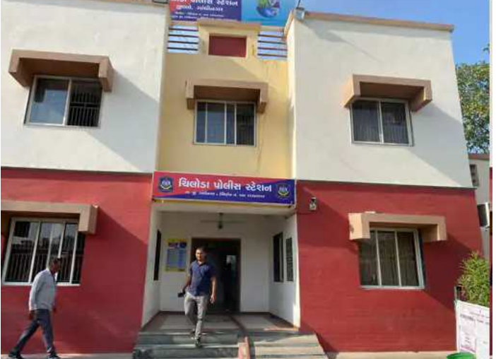
છવાઈ ગયો હતો. ગઈકાલે કાળી ચૌદશની મોડી સાંજે માર્ગ અકસ્માત આ બનાવમાં શ્રમજીવીને કાળ ભરખી ગયાની

ગાંધીનગરનાં મહુન્દ્રા પાટીયા નજીક કોસ કરતાં શ્રમજીવીનું ગઈકાલે કાળી ચૌદશની મોડી સાંજે બાઈકની ટક્કરથી ગંભીર ઈજાઓ થવાથી ટૂંકી સારવાર દરમિયાન મોત નિપજ્યું છે. આ અંગે ચીલોડા પોલીસે અકસ્માતે મોતનો ગુનો દાખલ કરીને કાર્યવાહી હાથ ધરી છે. દિવસ દરમિયાન મજૂરી કર્યા પછી પરિવાર માટે મીઠાઈની ખરીદી કરવા શ્રમજીવી રોડ કોસ કરી રહ્યો હતો. ત્યારે ઘરે મીઠાઈની જગ્યાએ સ્વજનની લાશ પહોંચતા પરિવારમાં માતમ