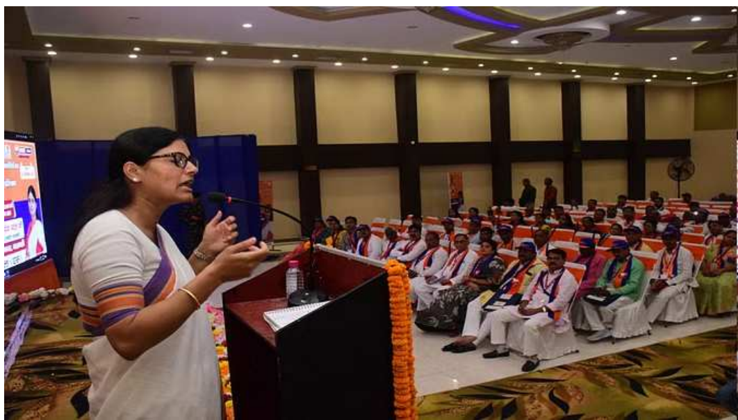
લખનૌ,તા.૫ અપના દળના રાષ્ટ્રીય અધ્યક્ષ, કેન્દ્રીય વાણિજ્ય અને ઉદ્યોગ રાજ્ય મંત્રી અનુપ્રિયા પટેલે કહ્યું છે કે પાર્ટીને યુપીમાં નંબર વન રાજકીય પાર્ટી બનાવવી પડશે. આ માટે બધાએ પૂરા દિલથી કામ કરવું પડશે. હાલમાં અમે રાજ્યમાં ત્રીજા

નંબરની સૌથી મોટી પાર્ટી છીએ. એક સમય હતો જ્યારે આપણે મત કટવા કહેવાતા. હવે એ સાબિત થઈ ગયું છે કે અમારી સંસ્થા દલિતો, પછાત લોકો અને શોષિતો માટે સૌથી વધુ કામ કરી રહી છે. અનુપ્રિયા પટેલ અયોધ્યાના એક મહેલમાં આયોજિત પાર્ટીના સ્થાપના દિવસ સમારોહને સંબોધિત કરી રહ્યા હતા. સંમેલનમાં કાર્યકરોની ભારે ભીડ જોઈને મુદિત અનુપ્રિયાએ કહ્યું કે પાર્ટીની લોકપ્રિયતા વધી રહી છે. આવી સ્થિતિમાં જે લોકો તેને પચાવી શકતા નથી, તેમના હૃદયના ધબકારા વધી જાય છે. અફવાઓ ફેલાવવામાં આવશે. હેચિંગ કાવતરાં સાથે, કાવતરાં પણ હશે. આવી સ્થિતિમાં, વ્યક્તિએ સતર્ક અને સાવચેત રહેવાની જરૂર છે. તેમણે કહ્યું કે પછાત વર્ગોના કલ્યાણ માટે લઘુમતી મંત્રાલયની તર્જ પર પછાત વર્ગ કલ્યાણ મંત્રાલય પણ બનાવવું જોઈએ. આ ઉપરાંત અખિલ ભારતીય ન્યાયિક સેવાની રચના કરવી જોઈએ, જેથી દલિત અને પછાત વર્ગના આશાસ્પદ યુવાનોને ન્યાયતંત્રમાં ન્યાયાધીશ બનવાની તક મળી શકે. કોઈપણ રીતે, હાઈકોર્ટ અને સુપ્રીમ કોર્ટમાં જજો ઓછા છે. કેસોનો સમયસર નિકાલ થતો નથી. અનુપ્રિયાએ