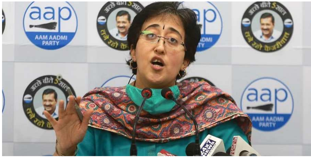
દિલ્હીમાં હવા સતત ઝેરી બની રહી છે અને વાયુ પ્રદૂષણ ની દિલ્હીના લોકોને શ્વાસ લેવામાં મુશ્કેલી આવી રહી છે ત્યારે દિલ્હીના શિક્ષણ મંત્રી આતિશી (જેજરે)એ વાયુ પ્રદૂષણને ધ્યાનમાં રાખીને

ગંભીર સ્થિતિમાં છે તેમજ વાયુ પ્રદૂષણને કારણે લોકોની હાલત ખરાબ છે ત્યારે દિલ્હીના શિક્ષણ મંત્રી આતિશી (જેજરે)એ વાયુ પ્રદૂષણને ધ્યાનમાં રાખીને