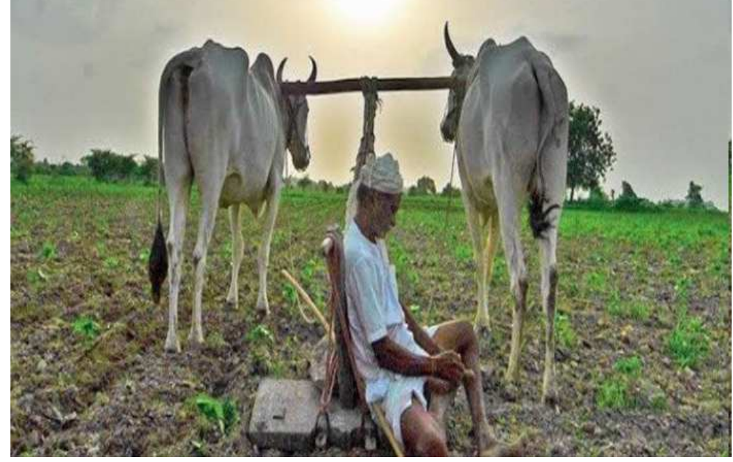
આણંદ : ગત સપ્ટેમ્બર છોડવામાં આવતા ગાંડીતૂર માસમાં થયેલા ભારે વરસાદના બનેલી મહીસાગર નદીના કારણે તેમજ મહી નદીમાં પાણી પાણી આણંદ જિલ્લાના

દ્વારા નુકસાન અંગે સર્વે કરાયા બાદ હજુ સુધી સહાય ચૂકવવામાં ન આવતા ખેડૂતોમાં ભારે નારાજગી વ્યાપી છે. ઉપરવાસમાં થયેલા ભારે વરસાદના કારણે મહીસાગર નદીમાં પાણી છોડવામાં આવતા આણંદ જિલ્લાના બોરસદ, આંકલાવ, ઉમેરેઠ તથા આણંદ તાલુકાના મહી કાંઠાના સીમ વિસ્તારના ગામોમાં પૂરના પાણી ફરી વળ્યા હતા. જેને લઈ ખેતરોમાં ડાંગર, બાજરી, શાકભાજી સહિત તમાકુનો પાક ધોવાઈ જતા ખેડૂતોને લાખો રૂપિયાનું નુકશાન પહોંચ્યું હતું. પૂરના પાણી પ્રસર્પા બાદ તંત્ર દ્વારા સર્વેની કામગીરી હાથ ધરવામાં આવી હતી. ખેતીવાડી વિભાગ સૂત્રો પાસેથી