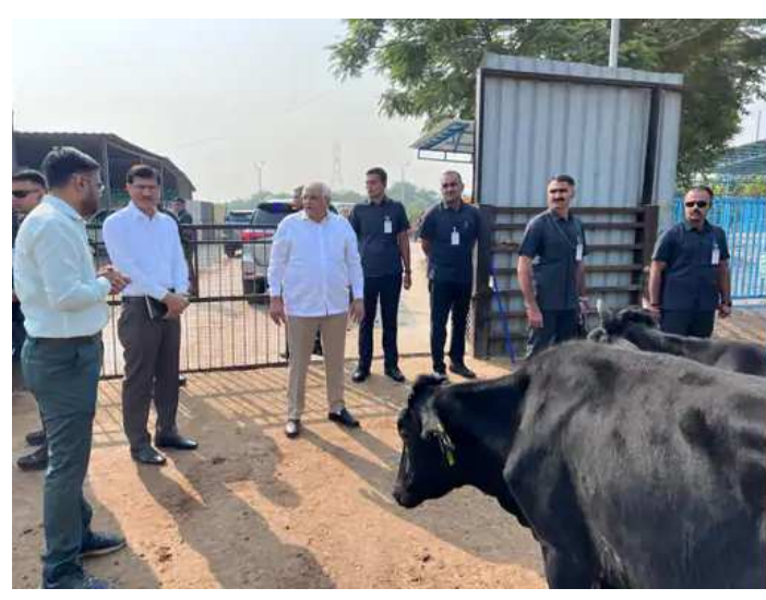
લઈ પશુઓને આપવામાં આવતો આહાર અને દેખભાળની વિગતો મેળવી જરૂરી સૂચનાઓ આપવામાં આવી હતી. ગાંધીનગર સેક્ટર - ૩૦ની પાંજરાપોળમાં ક્ષમતા કરતા વધુ પશુઓને ગોંધી રાખી ઘાસચારો, સફાઈ સહિતની સુવિધાના અભાવે ઢોર મોતને ભેટી રહ્યાના આશ્લેષો થતાં રહેતા હોય છે. આ મુદ્દે માલધારીઓની સાથે કોંગ્રેસ દ્વારા પણ ભૂતકાળમાં વિરોધ પ્રદર્શન પણ કરવામાં આવ્યા હતા. મ્યુનિસિપલ કોર્પોરેશન સંચાલિત સેક્ટર - ૩૦ નાં ઢોર ડબ્બામાં ક્ષમતા કરતાં વધુ માત્રામાં પશુઓને ઠાંસી ઠાંસીને રાખવામાં આવતા તેમજ યોગ્ય સાફ સફાઈ