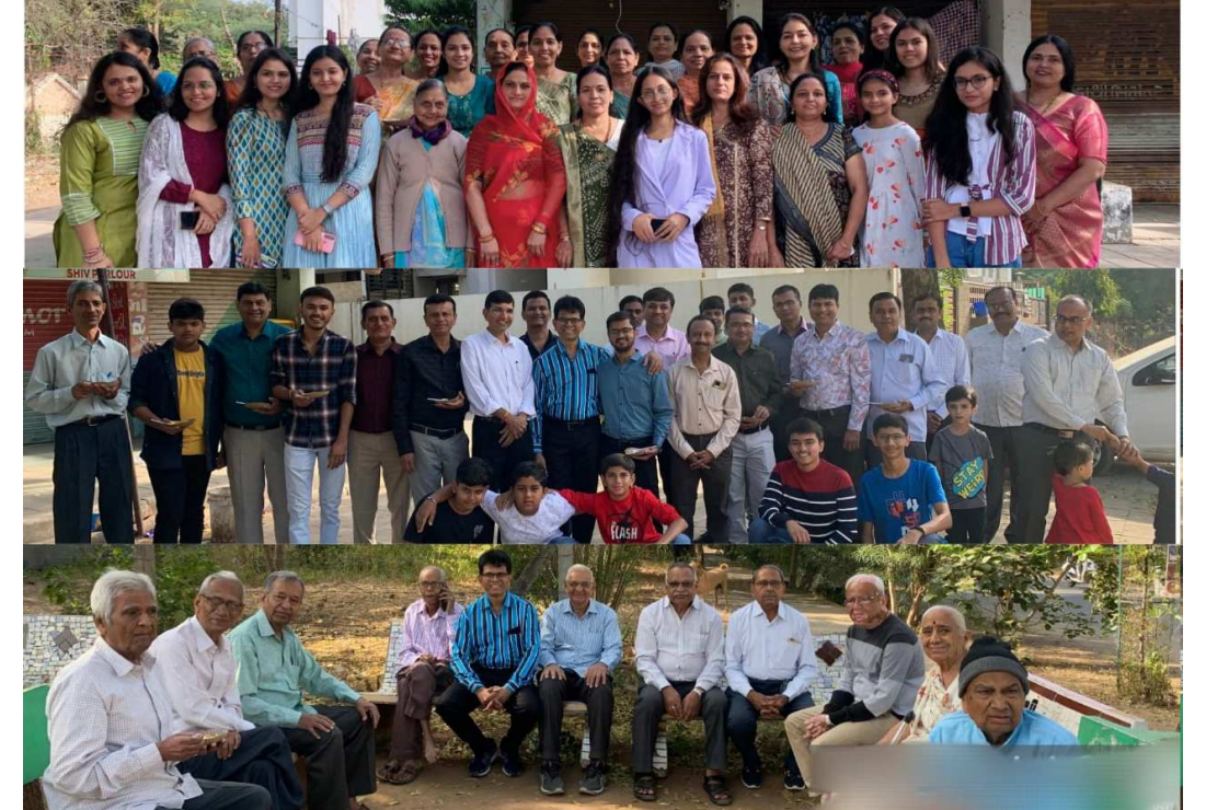
ગાંધીનગર સેક્ટર - ૮ ખાતે મંગલમૂર્તિ પાર્કમાં નૂતન વર્ષની નૂતન રીતે ઊજવણી પ્રેમભાવથી થાય છે. સવારે નવ વાગ્યે સૌ સભ્યો પરિવાર સાથે નવાં વસ્ત્રોમાં સજ્જ થઈ શોપિંગ સેન્ટર પાસે ભેગા થાય છે. એકબીજાને નૂતન વર્ષાભિનંદન કરી શુભેચ્છાની આપલે કરે છે. નાના બાળકો અને યુવાનો વડીલોને ચરણ સ્પર્શ કરી આશીર્વાદ મેળવે છે. સૌને અલ્યાહાર સાથે મીઠાઈ આપી માં મીઠું કરાવવામાં આવે છે. આજે જ્યારે ઘરે મીઠાઈ કરસાણથી શણગારેલી ટીપોચ મહેમાનોની રાહ જુએ છે ત્યારે એક જ જગ્યાએ ૧૫૦ - ૨૦૦ માણસો ભેગા મળીને વિક્રમ સંવત - ૨૦૮૦નું સ્વાગત કરી એકબીજાને નૂતન વર્ષાભિનંદન કરે એ આવકાર્ય પગલું કહેવાય.