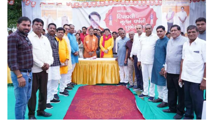
આપણે આપણા માર્ગમાં આવતા પડકારોને સ્થિતિસ્થાપકતા અને નિશ્ચય સાથે સ્વીકારીએ, ગુજરાત રાજ્ય તેના તહેવારોના વાર્ષિક રંગોની જેમ જળદળતું રહે. આશા, પુશી અને સફળતાથી ભરેલા નવા વર્ષની શુભેચ્છા. આવનારું વર્ષ આપણા સૌ પર અસંખ્ય આશીર્વાદોથી ભરેલું રહે તેવી શુભકામનાઓ. આ પ્રસંગે દશરથજી ઠાકોર જિલ્લા ભાજપ પ્રમુખ, નંદાજી ઠાકોર ઉપાધ્યક્ષ પ્રદેશ ભાજપ, અશોકભાઈ જોષી જિલ્લા લોકસભા પ્રભારી, કે.સી.પટેલ પૂર્વ મહામંત્રી પ્રદેશ ભાજપ, સ્થાનિક સંસ્થાઓના પ્રમુખ, ઉપપ્રમુખ, ચેરમેન, આગેવાનો, જીલ્લા, તાલુકા, શહેર ભાજપ સંગઠન હોદ્દદાર પદાધિકારીઓ તેમજ કાર્યકર્તાઓ હાજર રહ્યા હતા.

ગોકુલ મિલ ખાતે ભાજપ સિદ્ધપુર વિધાનસભા અને જિલ્લા ભાજપ દ્વારા આયોજિત દિવાળી અને નુતન વર્ષ સ્નેહ મિલન સમારોહ માનનીય કેબિનેટ મંત્રી બલવંતસિંહ રાજપૂતના અધ્યક્ષસ્થાને યોજાયું, સમાજના સૌ અગ્રણીઓ અને આગેવાનો સાથે શુભેચ્છાઓનું આદાન પ્રદાન કરવાનું સૌભાગ્ય પ્રાપ્ત થયું. વડાપ્રધાન નરેન્દ્રભાઈ મોદીજી ના નેતૃત્વમાં દેશ ને એક નવી દિશા મળી છે ખાસ કરીને યુવાનો અને મહિલાઓને તેમના કૌશલ્યને બહાર લાવવાની અને દેશના વિકાસમાં ફાળો આપવાની તક મળી છે જેના કારણે ભારત દેશનો દરેક ક્ષેત્રે વિકાસ થઈ રહ્યો છે. આપણે જૂના વર્ષને વિદાય આપીએ છીએ અને નવા વર્ષનું સ્વાગત કરીએ છીએ, જ્યારે આપણે આ નવી સફર શરૂ કરીએ ત્યારે એકતા અને એકતાની ભાવના પ્રવર્તે. ચાલો