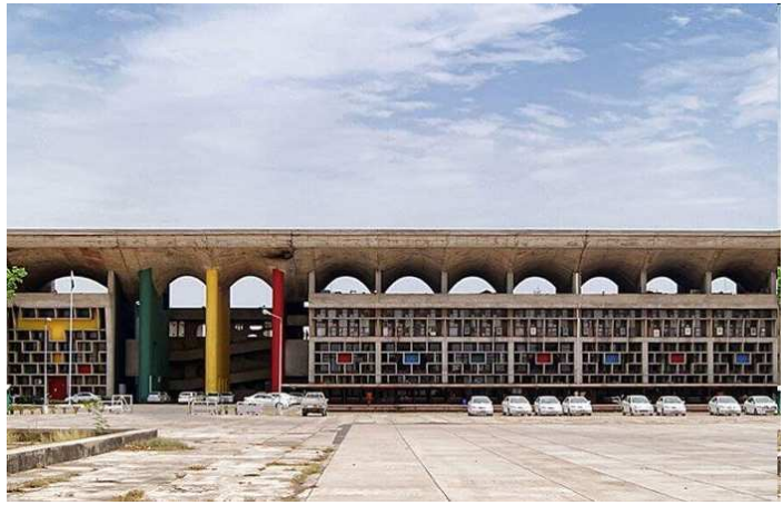
પંજાબ અને હરિયાણા હાઈકોર્ટે શુક્રવારે હરિયાણા સરકારને મોટો ઝટકો આપ્યો છે.

પલટાવી દીધો. આ કાયદા હેઠળ હરિયાણાના સ્થાનિક લોકોને પ્રાઈવેટ સેક્ટરની નોકરીમાં ૭૫ ટકા અનામત મળતું હતું. આ કાયદા હેઠળ હરિયાણા રાજ્ય સ્થાનિક ઉમેદવાર રોજગાર અધિનિયમ ૨૦૨૦ના હેઠળ રાજ્યની પ્રાઈવેટ કંપનીઓ, સોસાયટી, ટ્રસ્ટ અને પાર્ટનરશિપ ફર્મ આવે છે.