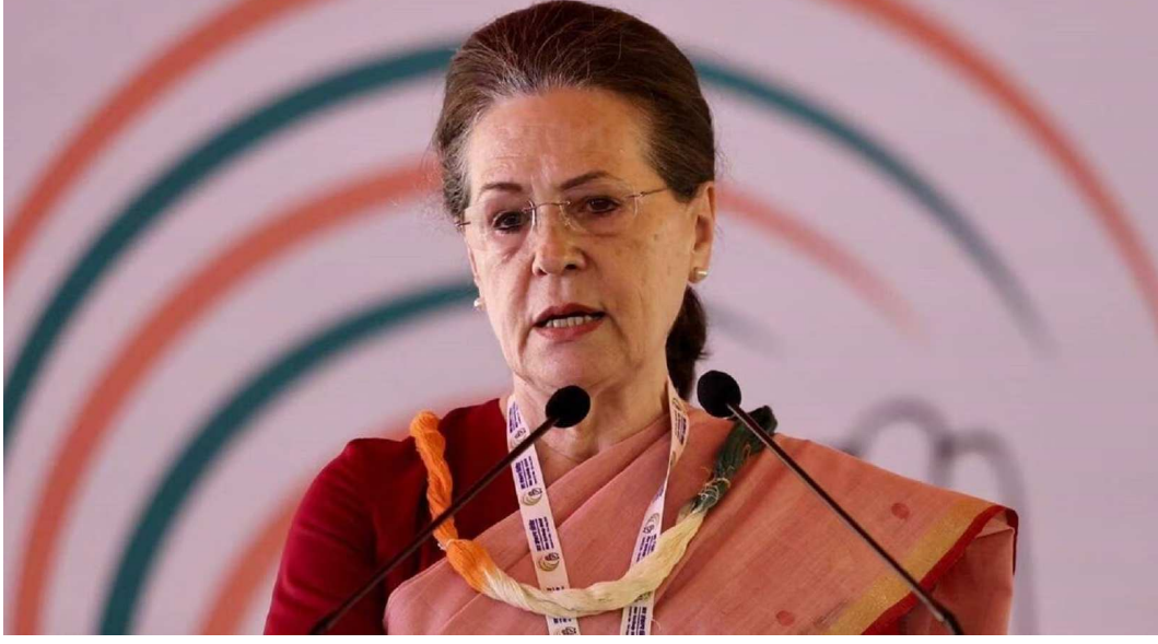
કોંગ્રેસ પાર્ટીના પૂર્વ અધ્યક્ષ સોનિયા ગાંધીએ ફરી એકવાર મોદી સરકાર સામે આકરા પ્રહારો કર્યા છે. રાષ્ટ્રીય સલાહકાર પરિષદ (દ્રણક) અંગે સોનિયાએ કહ્યું કે આ કોઈ બીજું પાવર સેન્ટર નહોતું પણ વડાપ્રધાનને સલાહ આપનાર

એક સમિતિ જ હતી. સોનિયા ગાંધીએ તેમના આવનારા પુસ્તક અંગે ખુલાસો કરતાં કેન્દ્રની મોદી સરકાર સામે પણ નિશાન તાક્યું. સોનિયા ગાંધીએ કહ્યું કે કેન્દ્રની મોદી સરકાર ખુલ્લેઆમ આરએસએસથી નિર્દેશો લઈને જ કામ કરે છે. આરએસએસ ન તો વિશ્વસનીય છે અને તો પ્રજાએ તેને ચૂંટી છે. 'એન્હાન્સિંગ પીપલ્સ રાઈટ્સ એન્ડ ફ્રીડમ - દ્રણક રીવિઝિટેડ' નામના લેખમાં સોનિયા ગાંધીએ લખ્યું છે કે આ જ વિડંબના છે કે દ્રણકને અપમાનિત કરાઈ.