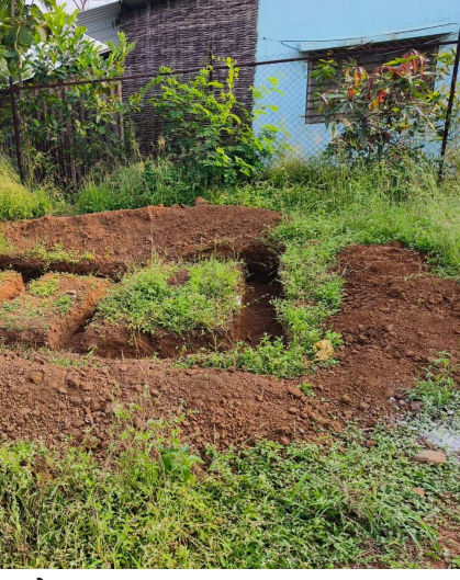
લાવી મુકવામાં આવેલ છે. એ પણ ભ્રષ્ટાચાર પુલ્યામ નજરે પડે છે. ગોઠડીયા ગ્રુપ ગ્રામ

પ્રાપ્ત વિગત અનુસાર વઘઈ તાલુકામાં સમાવિષ્ટ ગ્રુપ ગ્રામ પંચાયત ગોઠડીયા. ભ્રષ્ટાચાર નું નજરાણું જેવાં કોશમાળ ગામે. પેવર બ્લોક માં ડસર્ટ પાથર્થા વગર ની કામગીરી જાણવા મળે છે. તો આ કામ માં વઘઈ તાલુકા પંચાયત નાં ઈજનેર દ્વારા તપાસ કરી બીલો પાસ કરવા જરૂરી...? અને બીજી બાજુ થી જાહેર શૌચાલય ની કામગીરી. એસ્ટીમેન્ટ મુજબ બનવી જોઈએ. તેનાં બદલે કાચી ઈટના જથ્થો સ્થળ પર