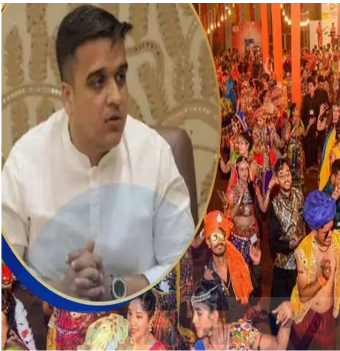
(અ.આર.એલ) ગાંધીનગર, ૧૭ ઓક્ટોબર, ૨૦૨૩. ગરબા બંધ કરાવવા આવી જતી હતી, પરંતુ આ નવરાત્રિએ આવું નહિ બને. રમી શકાતા હતા. રાત્રે ૧૨ વાગ્યા બાદ પોલીસ ગરબા બંધ કરાવવા આવી જતી હતી, પરંતુ આ નવરાત્રિએ આવું નહિ બને. કારણ કે, ગુજરાત સરકારે આ

અંગે મોટો નિર્ણય લીધો છે. હવે રાત્રે ૧૨ વાગ્યા બાદ પોલીસ ગરબા બંધ કરાવવા નહિ આવે. સરકારના આ નિર્ણયથી હવે મોટી રાત સુધી ગરબાનો રંગ જામશે. હવેથી રાત્રે ૧૨ વાગ્યે ગરબા બંધ નહિ થાય. સરકાર દ્વારા લીલી ઝંડી અપાઈ ગઈ કે, હવે ગમે તેટલા વાગ્યા સુધી ગરબા કરો.