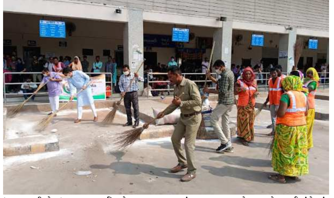
‘સ્વચ્છતા હી સેવા’ - અમદાવાદ જિલ્લો અમદાવાદના સાણંદ નગરના બસ સ્ટેશન ખાતે સફાઈ રુંબેશનું આયોજનસાણંદ તાલુકા પંચાયતના પ્રમુખ અને પૂર્વપ્રમુખ સહિતના આગેવાનોએ સ્વચ્છતા માટે કર્યું શ્રમદાનબસ સ્ટેશન સ્વચ્છ અને સુધડ બનતા મુસાફરોએ વ્યક્ત કર્યો આનંદ