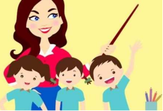
દેશનો આધાર સ્તંભ છે. તે ઈમારતનો એક પાયો છે. એ પાયોને મજબૂત કરવાનું કામ શિક્ષક કરે છે. તેઓ ઈમારતનું પાકું ચણતર કરી તેને કઠી ડગવા દેતા નથી. ખુબ સાદી અને સરળ રીતે કહી શકાય કે જે શિક્ષા આપે તે શિક્ષક. જે જીવન ઘડતરમાં મદદરૂપ થાય અને જીવનનાં મૂલ્યોની સાચી સમજ આપે એ શિક્ષક. શિક્ષકનું યોગદાન સમાજમાં ઘણું મહત્વનું છે. ભગવાન શ્રીરામ અને શ્રીકૃષ્ણએ પણ શિક્ષા મેળવવા માટે બાળપણમાં પોતાનું ઘર છોડીને શિક્ષા મેળવી અને પોતાનાં જીવનને સાર્થક બનાવ્યું. વિદ્યા જેવું અમૂલ્ય ધન મેળવવા માટે આપણે હંમેશા એક સારા ગુરૂની શોધ કરતા હોઈએ છીએ, કારણ કે એક સારા શિક્ષક જ ભવિષ્યનું નિર્માણ કરી શકે છે. આચાર્ય ચાણક્ય કહેતા કે શિક્ષક ક્યારેય સામન્ય નથી હોતા, પ્રલય અને નિર્માણ હંમેશા એનાં ખોળામાં રમે છે. સારા શિક્ષક એ જ છે જે કાર્ય કરતા પહેલા વિચારે છે, કાર્ય કરતી વખતે વિચારે છે, અને કાર્ય કર્યા બાદ પણ તેનું જ ચિંતન કરે છે. આજે લોકો શિક્ષણ પ્રત્યે જાગૃત છે પણ આ ક્ષેત્રમાં હજુ ઘણું કરવાનું બાકી છે. આજનું શિક્ષણ આપણને ભૂતકાળ સાથે જોડે છે, પરંપરા સાથે જોડે છે પરંતુ ભવિષ્ય સાથે બહુ ઓછું નિર્યત રાખે છે. ખરેખર તો અત્યારે શું કરવું જોઈએ તેનાં પર પણ શિક્ષણમાં સંશોધન કરવું જરૂરી છે.

આપણે પહેલા લોકોના પદ પૈસો પાવર અને પોઝિશનથી અંજાઈ જતા હતા. હવે એમાં ઓટ આવી છે. ખુદના માટે સમય કાઢી લવ છું. મારા ખભા પર દુનિયા ટકી નથી મારાં વગર કઈ અટકી પડવાનું નથી મારાં પરિવાર સાથે ખુદને પણ પ્રેમ કરવા લાગ્યો છું નાના વેપારી અને ફેરિયાઓ સાથે ભાવતાલ કરવાનું બંધ કર્યું છે ક્યારેય ખબર હોય છે કે વધારે પૈસા જઈ રહ્યા છે પણ હસતું મોં રાખી જતું કરું છું ભંગાર કે પસ્તી વીણવા નીકળતા લોકોને ભંગાર કે પસ્તી કે તેલનો ખાલી ડબ્બો એમ જ આપી દઉં છું પચીસ કે પચાસ રૂપિયા જતા કરું છું ત્યારે એના મોઢા પર હજારો મળી ગયાનો આનંદ જોઈ ખુશ થાવ છું. એવી જ રીતે રોડ પર પાથરણુ પાથરી વેપાર કરતા વ્યક્તિઓ પાસેથી ક્યારેક મને કઈ જ કામની ના હોય એવી નકામી વસ્તુ પણ ખરીદી લઉં છું એમનો વેપાર કરવાનો ઉત્સાહ જોઈ આનંદ થાય છે વડીલો અને બાળકોની એકની એક વાત કેટલીય વાર સાંભળી લઉં છું કહેવાનું બંધ કરી દીધું છે કે તેઓ આ વાત ઘણી વાર કહી