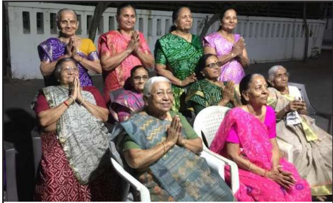
સર્વોદય સ્વતંત્ર પ્લોટ સોસાયટી, ભુચંગદેવ ચાર રસ્તા ખાતે સિનિયર સિટિઝન મહિલાઓ દ્વારા નવરાત્રિ માં આરતી પૂજા પ્રસાદ ધરાવી બેઠાં ગરબા ગવાડવામાં આવે છે