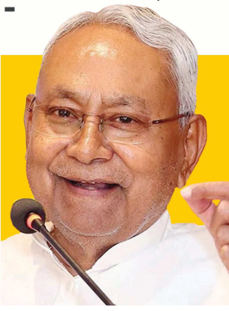
શાહ (છદ્દે જરહર) સાથે મુલાકાત કરી હતી. ત્યારબાદ તેમણે કહ્યું કે, હું ચૂંટણીને ધ્યાને રાખી મુલાકાત કરવા આવ્યો હતો

પટણા, તા. ૦૨ બિહારના પૂર્વ મુખ્યમંત્રી અને હિન્દુસ્તાની આવામ મોર્ચા (સેક્યુલર)ના સંસ્થાપક જીતન રામ માંઝી (લેફ્ટ ઈલેક્ટ્રિકલ ડેવલપર્સ) આગામી કોઈપણ ચૂંટણી ન લડવાની જાહેરાત કરી છે. ઉપરાંત તેમણે લાલુ પ્રસાદ યાદવ (નકલે ડિજિટલ રૂઝવણી) અને તેજસ્વી યાદવ (લિટલ ટુલુ) નો ઉલ્લેખ કરી નીતીશ કુમાર (ટૂં જર બ્રેકફાસ્ટ) પર આકરા પ્રહારો કર્યા છે. માંઝીએ આ