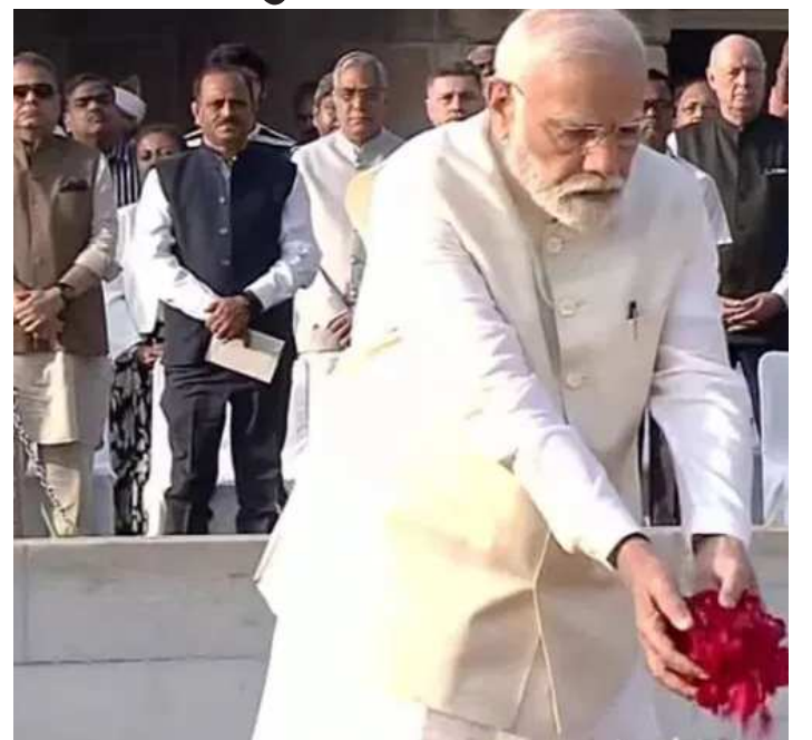
આપે છે ભારતની પ્રગતિ પ્રત્યેની તેમની અતુટ પ્રતિબદ્ધતા અને પડકારજનક સમયમાં તેમનું નેતૃત્વ

રાષ્ટ્રપતિ દ્રૌપદી મુર્મુએ પણ રાજઘાટ પહોંચીને ગાંધીને તેમની જયંતિ પર શ્રદ્ધાંજલિ આપી હતી. અગાઉ એક ઓક્ટોબરની સાંજે રાષ્ટ્રપતિ મુર્મુએ લોકોને દેશના કલ્યાણ માટે સમર્પિત થઈને તેમના વિચારો, ભાષણ અને કાર્યોમાં ગાંધીજીના મૂલ્યો અને શિક્ષાઓનું પાલન કરવાની અપીલ કરી હતી. મહાત્મા ગાંધીની ૧૫૪મી જન્મજયંતિ નિમિત્તે ભાજપના રાષ્ટ્રીય