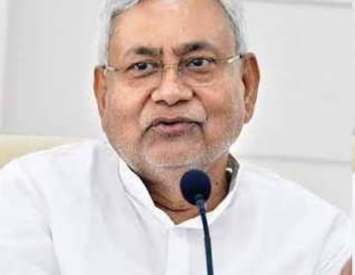
રહે છે. આજે આયોજિત પ્રેસ કોન્ફરન્સમાં કહેવામાં આવ્યું

બિહારમાં નીતિશકુમારની સરકારે જાતિય આધારિત વસ્તી ગણતરીના આંકડા જાહેર કર્યા છે, નીતીશ સરકારના આ પગલાને કારણે ઘણા રાજકીય પક્ષોને તેમની રણનીતિ બદલવી પડી શકે છે. સરકારી અહેવાલ મુજબ, બિહારમાં વસ્તી ૩૬ ટકા અત્યંત પછાત, ૨૭ ટકા પછાત વર્ગ, ૧૯ ટકાથી થોડી વધુ અનુસૂચિત જાતિ અને ૧.૬૮ ટકા અનુસૂચિત જનજાતિના લોકો