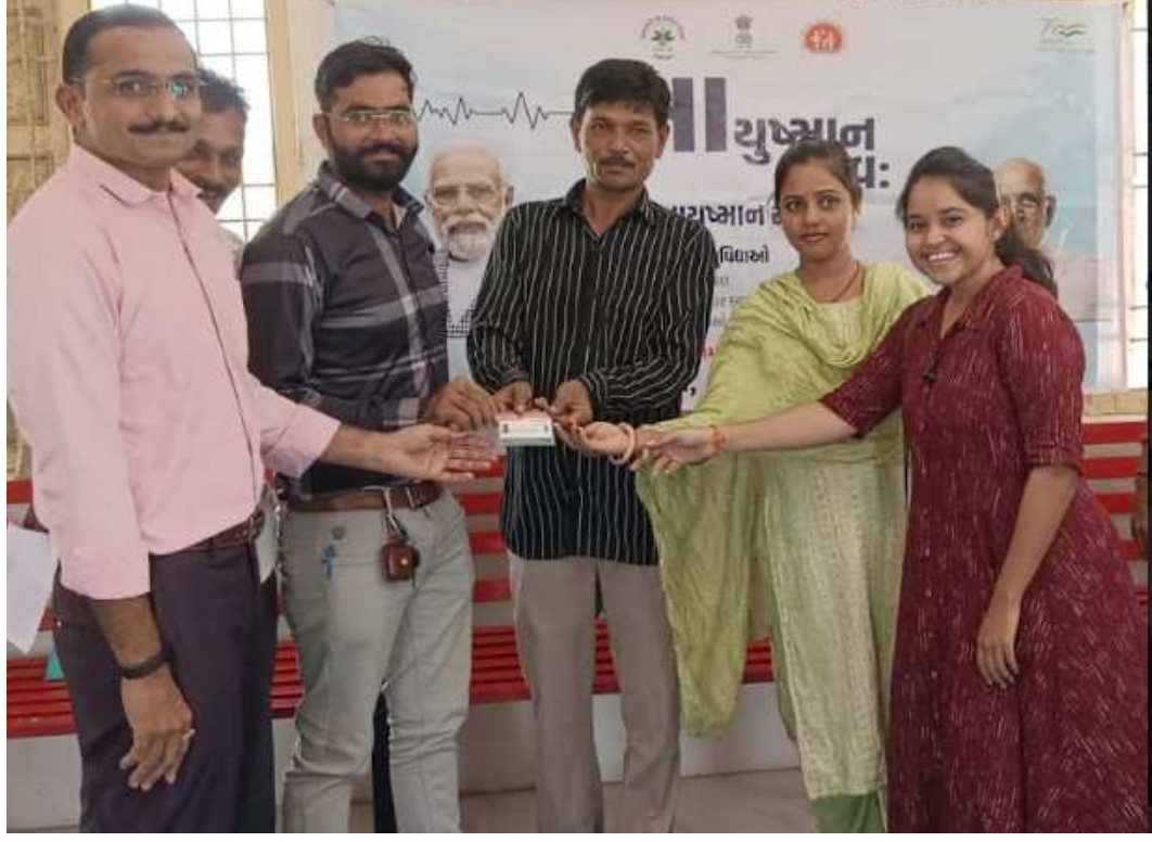
સબકી યોજના સબકા ઓક્ટોબરના રોજ રાજુલા ગ્રામસભાનું આયોજન વિકાસ કાર્યક્રમ અંતર્ગત બીજી તાલુકાના ગામડાઓમાં કરવામાં આવેલ જેમાં રાજુલા