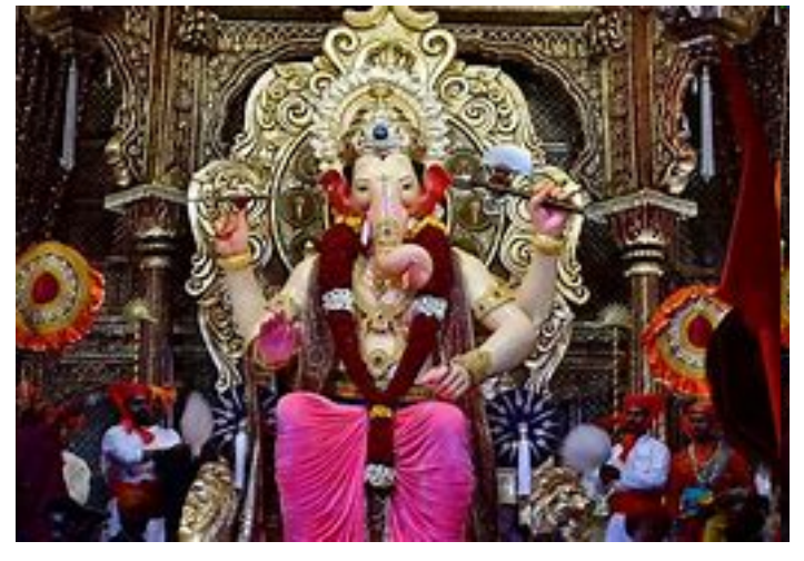
ગણપતિ બાપા મોરિયા

શુભ કર્તા દુખ હર્તા બાપા મોરિયા મંગલ મૂર્તી મોરિયા સહુનું હૃદય ચોરિયા