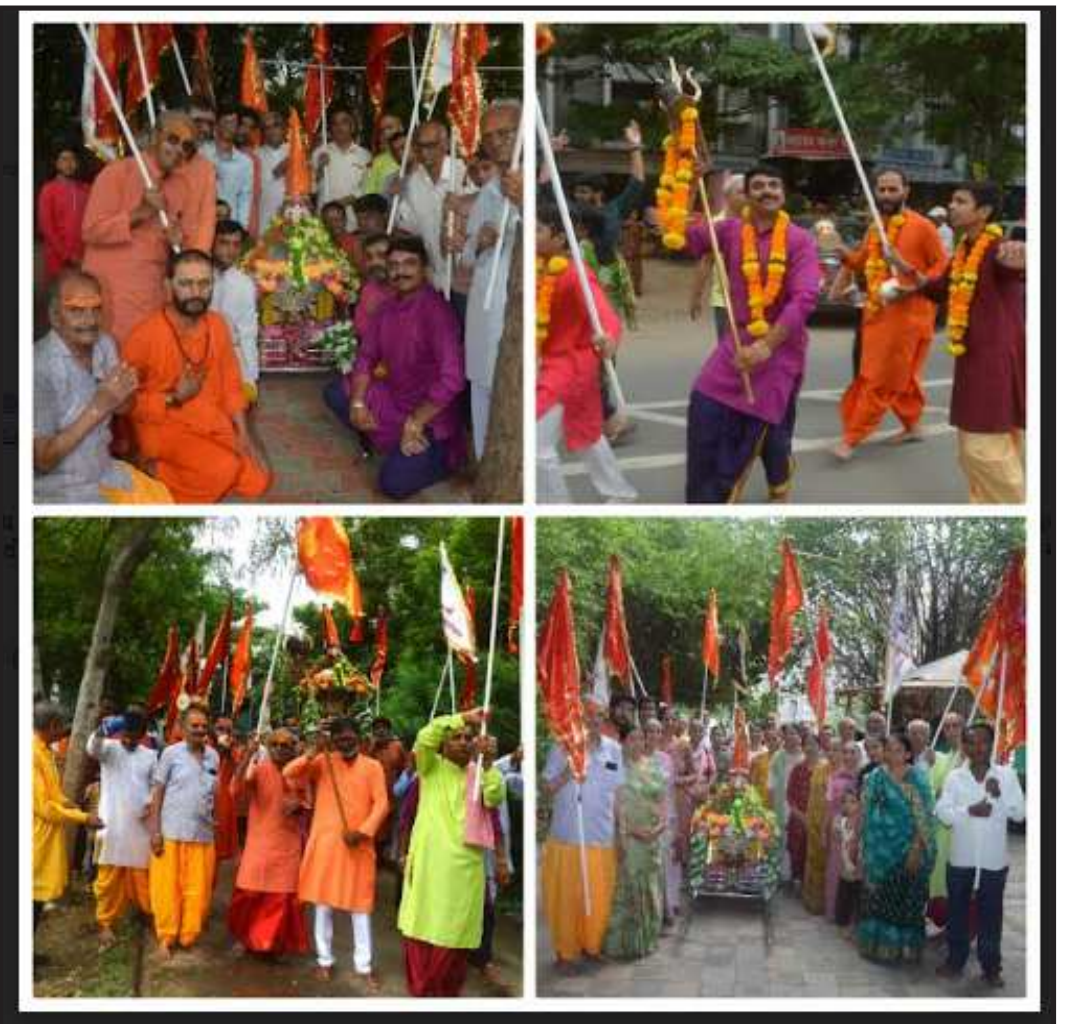
ગોતાના વંદેમાતરમુ વિસ્તારમાં સ્થિત સોમનાથ મહાદેવના ભવ્ય મંદિરેથી લગભગ પાંચસો ભક્તો દ્વારા ઢોલ નગારા , છડી પખાવજ , મશાલ સહિત ગોતા ચાંદલોડિયા રોડ પર સોમનાથ દાદાની નગર યાત્રા નીકળી. શ્રાવણ માસ ની પવિત્ર એકાદશી એ વસુધૈવ કુટુંબકમ ની ભાવના લોકો માં વ્યાપ્ત બને , ધર્મ જવાબદારી પ્રગટે , લોકો ધર્મ પ્રત્યે જાગ્રત બને , સાંપ્રત વિસંગતતાઓ દૂર થાય , ધાર્મિકતાથી સામાજિક નવ ચેતના પ્રગટે તથા નવીન પેઢી ને ધર્મની સમજ મળે તેવા ઉમદા હેતુ થી આ નગર યાત્રા કરવામાં આવી. અસ્તુ સદા શિવોલ્કમ્. ...

ધોયા. તેમજ ખેડુત અગ્રણી વાળા ભરતસિંહ તરેડીએ? મેથળા બંધારાની ૧૯૮૫ થી તે ૨૦૨૩ સુધીનો ટુકો ઈતિહાસ રજુ કરી સરકાર પર તાતા પ્રહારો કર્યા ૨૦૦૭ હાલના વડાપ્રધાન નરેન્દ્રભાઈ મોદીએ મેથળા બંધારો રૂપીયા ૩૫ કરોડના ખર્ચથી બનાવી આપવા જાહેરાત કરેલી ૨૦૧૫ મા મુખ્યમંત્રી આનંદીબેન પટેલે શીહોરમા ૫૫ કરોડના ખર્ચે મેથળા બંધારો સાકાર થશે તેવી જાહેરાત શીહોરમા કરેલી તે ફોગટ અને લોલીપોપ જણાતા આ વિસ્તરના લોકોએ ૨૦૧૮ મા જાતમહેનત જીદાબાદ અપના હાથ જગનાથના સુત્ર બોલી મેથળા બંધારો બનાવવા લોકોએ પ્રતિજ્ઞા સાથે સંકલ્પ કર્યા એટલે તા. ૧૭/૭/ ૨૦૧૮ ના રોજ મુખ્યમંત્રી વિજયભાઈ રૂપાણીએ ૮૬ કરોડના ખર્ચે સિધ્ધાતીક મજુરી આપી પણ તે? વાહિયાત અને છેતરામણા વચનો જણાતા લોકોએ દહ મનોબળથી તા. ૬/૪/ ૨૦૧૮ ના રોજ આશરે ૫૬૨ હજારથી વધારે શ્રમયોગી બની ત્રણ મહિનામા મેથળા બંધારો ફક્ત રૂપીયા ૫૫ લાખના લોક ફાળાથી સાકાર કરી બતાવ્યો અને તેમા ૭૫૦ એફ.ટી. એમ મીટું પાણી ભરાઈ છે તેથી આ વિસ્તરના લોકો અભીનંદને પાત્ર છે. તેમજ હાલમા સરકારે મેથળા બંધારો બનાવવા રૂપીયા ૧૩૭ કરોડ મંજુર કર્યા પણ આજદીન સુધી સરકારે એક ઈંટ માડી નથી તેનુ મુખ્ય કારણ સરકાર અલટ્રાટે સિમેન્ટ કંપનીની તરફેણ કરે છે અને એક મહિના પહેલાં પાણી પૂરવઠા મંત્રી કુવરજીભાઈ બાવળીયા મેથળા બંધારે આવેલા પણ અલટ્રાટેક કંપની બાજુ? મોઢું રાખી કંપનીને ઉની આચ ન આવે તેનુ નીરીક્ષણ કરી ચાલતી પકડી તેવા ચચોટ ચાળખા ભરતસિંહ તરેડીએ? કર્યા તેથી લોકોમા જોમ અને ખુશી જોવા મળી તેમ ભાવનગર જીલ્લાના ખેડુત અગ્રણી વાળા ભરતસિંહ પોપટભા તરેડી જણાવી રહ્યા છે