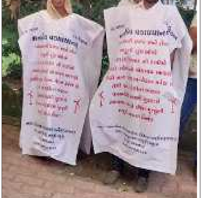
સેની ના ત્રાસ થી બચવા ઓછા મૃત્યુ માંગતું દંપતી...