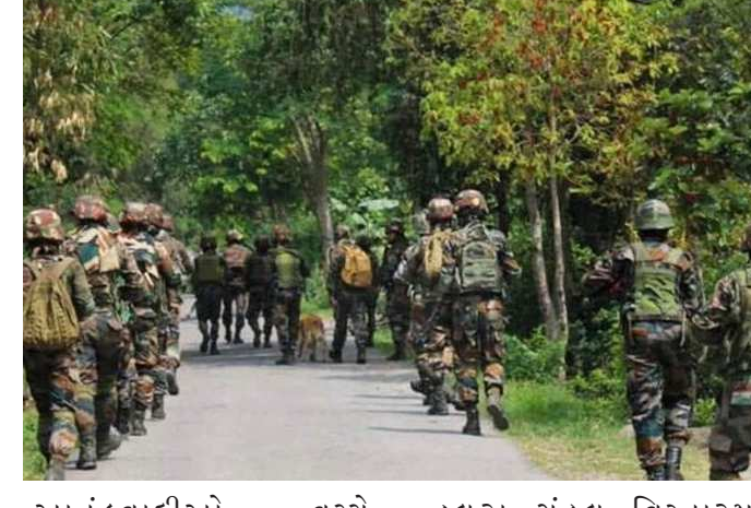
આતંકવાદીઓ વચ્ચે અથડામણ શરુ થઈ ગઈ છે. સુત્રોમાંથી જણાવવામાં આવ્યું છે કે અનંતનાગના કોકરનાગ હલૂરા ગંડૂલ વિસ્તારમાં સુરક્ષાદળોના જવાન અને આતંકવાદીઓ વચ્ચે ગોળીબાર થઈ રહ્યો છે.

કાશ્મીરના અનંતનાગ જિલ્લામાં સુરક્ષાદળોના જવાન અને આતંકવાદીઓ વચ્ચે અથડામણ શરુ થઈ છે સુત્રોમાંથી મળતી માહિતી મુજબ આ અથડામણમાં સેનાના અને જમ્મુ કાશ્મીરના એક અધિકારી ઘાયલ થયા છે. જમ્મુ કાશ્મીરમાં સેના અને પોલીસ સતત આતંકવાદીઓનો સફાયો કરવા માટે ઓપરેશન ચલાવી રહી છે ત્યારે હવે દક્ષિણ કાશ્મીરના અનંતનાગ જિલ્લામાં સુરક્ષાદળો અને