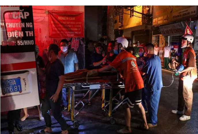
લોકો રહેતા હતા. આગ લાગવાના થોડા સમય બાદ ઘટનાસ્થળે ફાયર બ્રિગેડની ટીમ પહોંચી હતી. આ ૯ માળના એપાર્ટમેન્ટમાં આગ લાગ્યા બાદ મોટી રાત્રે ફાયરબ્રિગેડની ટીમે

વિયેતનામની રાજધાની હનોઈમાં ૯ માળના એપાર્ટમેન્ટમાં આગ લાગવાથી ઘણાં લોકોએ જીવ ગુમાવ્યો હતો. અહેવાલ મુજબ એપાર્ટમેન્ટમાં લાગેલી બીજા આગને કારણે લગભગ ૫૦ લોકો મૃત્યુ પામી ચુક્યા છે. આ આગની ઘટના રાત્રે બે વાગ્યે બની હતી. ઈમારતમાં ઘટના સમયે લગભગ ૧૫૦ લોકો હાજર હતા. જો કે આગ પર કાબુ મેળવી લેવામાં આવ્યા બાદ બચાવ કામગીરી ચાલુ રખાઈ હતી. અહેવાલ અનુસાર આ એપાર્ટમેન્ટમાં લગભગ ૧૫૦