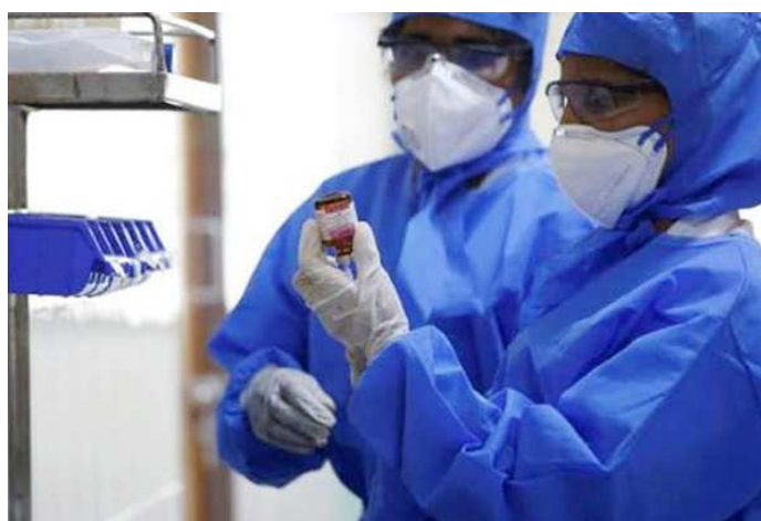
વસ્તુઓની દુકાનો જ ખુલવાની પરવાનગી છે. કેરળમાં નિપાહ વાયરસના અત્યાર સુધી ૪ કેસ સામે આવી ચુક્યા છે. જેમાં બે લોકોના મોત થયા છે. બુધવારે

કેરળના કોઝિકોડમાં નિપાહ વાયરસથી બે મોત બાદ હોસ્પિટલમાં માસ્ક ફરજિયાત કરી દેવામાં આવ્યું છે. આઈસોલેશન વોર્ડની બહારનો એન્ટ્રી સાઈન બોર્ડ પણ લગાવવામાં આવ્યા છે. કેરળના કોઝિકોડમાં નિપાહ વાયરસથી બે લોકોના મોત બાદ અન્ય ત્રણ જિલ્લા કઞ્ચર, વાયનાડ અને મલાપ્પુરમમાં એલર્ટ જાહેર કરવામાં આવ્યો છે. અહીંના ૭ ગ્રામ પંચાયતોને