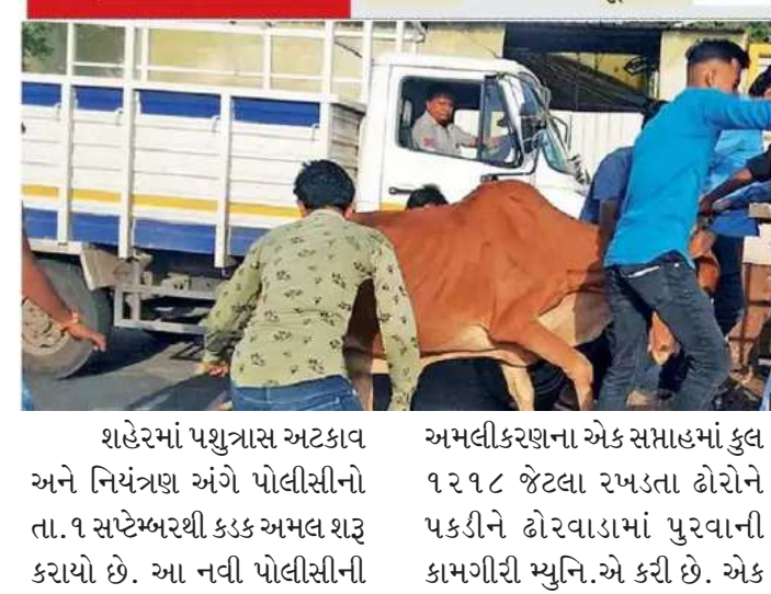
શહેરમાં પશુત્રાસ અટકાવ અને નિયંત્રણ અંગે પોલીસીનો તા.૧ સપ્ટેમ્બરથી કડક અમલ શરૂ કરાયો છે. આ નવી પોલીસીની અમલીકરણના એક સમાહમાં કુલ ૧૨૧૮ જેટલા રખડતા ટોરોને પકડીને ટોરવાડામાં પુરવાની કામગીરી મ્યુનિ.એ કરી છે. એક

સમાહમાં પકડાયેલા ટોરમાંથી ૭૦ ટકા રખડતાં ટોરો માત્ર પૂર્વ વિસ્તારમાંથી પકડાયા છે. એટલે કે ૮૫૦ જેટલા ટોરો પૂર્વમાંથી જ્યારે ૩૬૮ એટલે કે ૩૦ ટકા ટોર પશ્ચિમ વિસ્તારમાંથી પકડાયા છે. તેના પરથી કહી શકાય કે રખડતાં ટોરોનો ત્રાસ પશ્ચિમની સરખામણીમાં પૂર્વ વિસ્તારમાં વધારે છે. જ્યારે ઝોન પ્રમાણે જોવા જઈએ તો દક્ષિણઝોનમાં સૌથી વધુ ૩૮૨ અને પૂર્વઝોનમાં ૧૭૫ ટોર મ્યુનિ.ના પાંજરે પુરાયા છે. બીજી તરફ શહેરમાં સૌથી ઓછા રખડતાં ટોર દક્ષિણ પશ્ચિમ ઝોનમાંથી માત્ર ૮૦ જ પકડાયા છે. ઉપરાંત નવી ટોર પોલીસી અંતર્ગત મ્યુનિ.ના સીએનસીડી વિભાગ દ્વારા કામગીરી ટોર માલિકોમાં રોષ જોવા મળી રહ્યો છે. ઘણી જગ્યાએ ટોર પકડતી મ્યુનિ.ની ટીમ સાથે ધર્ષણના બનાવો બની રહ્યા છે. જેમાં ઓઢવમાં ટોર પકડવા ગયેલી મ્યુનિ.ની ટીમ ઉપર તો ટોળાએ હુમલો કરીને એક કર્મચારીને માર માર્યો હતો.