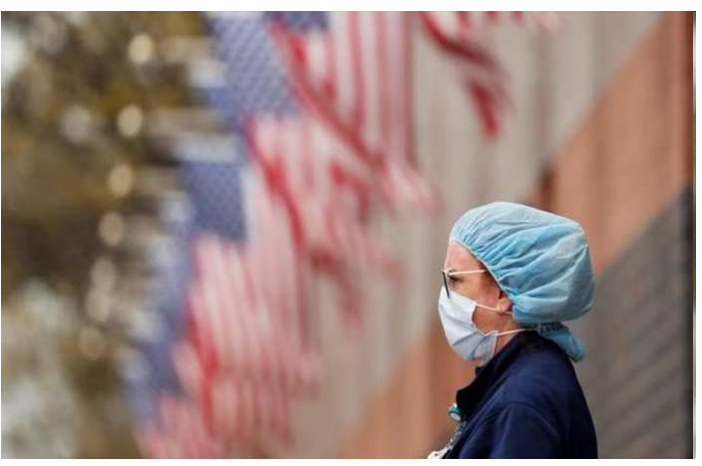
દાખલ કરવાનો વારો આવ્યો છે. અમેરિકાના સેન્ટર ફોર ડિસિઝ કન્ટ્રોલના ડાયરેક્ટર મેરી કોહેનનું કહેવું છે કે, જે લોકોએ કોરોનાની

વોશિંગ્ટન, તા. ૨ અમેરિકામાં કોરોના ફરી એક વખત માથું ઉંચકી રહ્યો છે. અમેરિકામાં ઉનાળાનો અંત આવી રહ્યો છે ત્યારે કોરોનાના કેસોમાં ફરી વધારો નોંધાઈ રહ્યો છે. એક જ સપ્તાહમાં કોરોનાના કારણે હોસ્પિટલમાં ભરતી થયેલા દર્દીઓની સંખ્યામાં ૧૯ ટકાનો વધારો નોંધાયો છે. જ્યારે કોરોનાના કારણે થતા મોટની સંખ્યા ૨૧ ટકા જેટલી વધી ગઈ છે. મળતા આંકડા અનુસાર એક જ સપ્તાહમાં ૧૦૦૦૦ લોકોને કોરોનાના કારણે હોસ્પિટલમાં