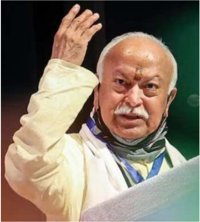
રાષ્ટ્રીય સ્વયંસેવક ભાગવતે આજે યોજાવેલ એક સંઘના સુપ્રીમો મોહન કાર્યક્રમ દરમિયાન લોકોને

ઈન્ડિયાને બદલે ભારત નામ બોલવા માટે અપીલ કરી હતી. તેમણે કહ્યું, સદીઓથી આ દેશનું નામ ભારત છે, ઈન્ડિયા નહીં. એટલા માટે આપણે તેના જૂના નામનો જ બોલવાની ભાષામાં ઉપયોગ કરવો જોઈએ.