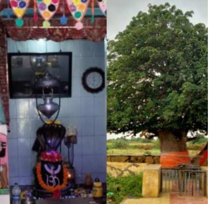
લખપત તાલુકાના દયાપરથી ત્રણ કિલોમીટર દુર કમલેશ્વર મહાદેવનું અતિ પ્રાચીન શિવાલય આવેલું છે. આ મંદિરની વિશેષતા એ છે કે મંદિરની બીલકુલ સામે થોડે દુર એક કલ્પવૃક્ષ આવેલું છે જે એક હજાર કરતા પણ વધારે વર્ષ જુનું હોવાનું કહેવાય છે. આવા કલ્પવૃક્ષ ભારતમાં માત્ર બે જ જગ્યામાં આવેલા છે એક અહીં તેમજ બીજું હિમાલયમાં આવેલું હોવાનો ઉલ્લેખ છે. આ વૃક્ષમાં જો કોઈ પણ જાતના પ્રહાર કરવામાં આવે તો એમાંથી લોહી નીકળતું હોય એવા લાલ રંગનું પ્રવાહી નીકળે છે થી શ્રાવણ માસ દરમિયાન અહીં દુર દુરથી મોટી સંખ્યામાં ભાવિક ભક્તો ઉમટી પડે છે. ભજન કીર્તન, મહા આરતી સહિત ના કાર્યક્રમો યોજવામાં આવે છે.