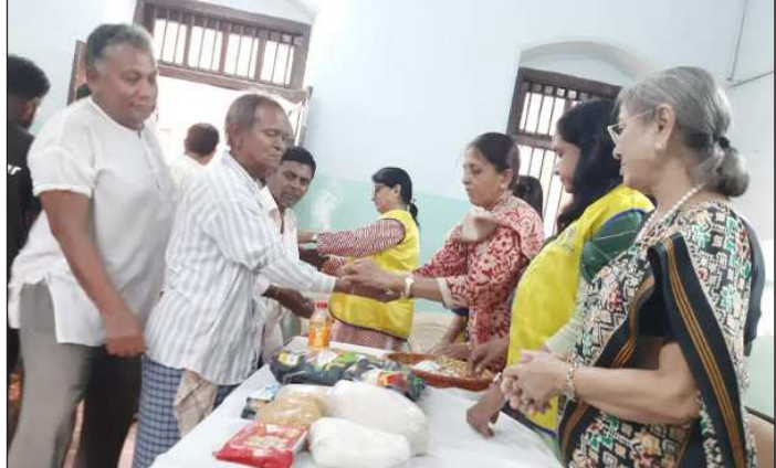
રક્તપિત નાં દર્દીઓ સાથે સ્વાલંબન ટ્રસ્ટ તથા લાયન્સ ક્લબ સમવેદના, જૈન એલર્ટ ગ્રુપ ઓફ ઈન્ડિયા ના સંયુક્ત ઉપક્રમે રક્ષા બંધનની ઊજવણી કરવામાં આવી. ઉપરાંત રક્તપિત દર્દીઓને જીવન જરૂરી ચીજ વસ્તુઓનું વિતરણ કરવામાં આવ્યું હતું.

સૌ સુખી રહે, સૌ ચાલનાર એટલે બ્રાહ્મણ. જે રોગમુક્ત રહે, સૌનું જીવન પોતાનું નહિ વિશ્વનું કલ્યાણ મંગલમય રહે અને કોઈ થાય તેવું વર માંગનાર એટલે દુ:ખમાં ભાગી ન બને. હે બ્રાહ્મણ. બ્રાહ્મણનું અપમાન ભગવાન અમને એવું એટલે સમગ્ર વિશ્વનું વરદાન આપો!... વિશ્વ અપમાન ગણાય છે તેવું કલ્યાણની ભાવના સાથે શાસ્ત્રોમાં કહેવામાં આવ્યું છે.