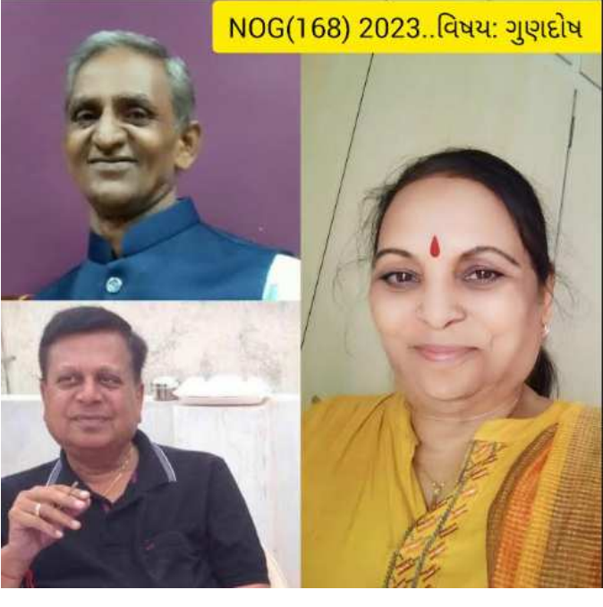
NOG(168) 2023..વિષય: ગુણદોષ