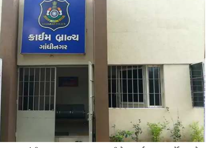
ગાંધીનગરના પુન્દ્રાસણ ગામ બસ સ્ટેન્ડની પાછળ આવેલ જુગારઘામ ખેતરમાં ચાલી રહેલા જુગારઘામનો એલસીબી - ૧ ની