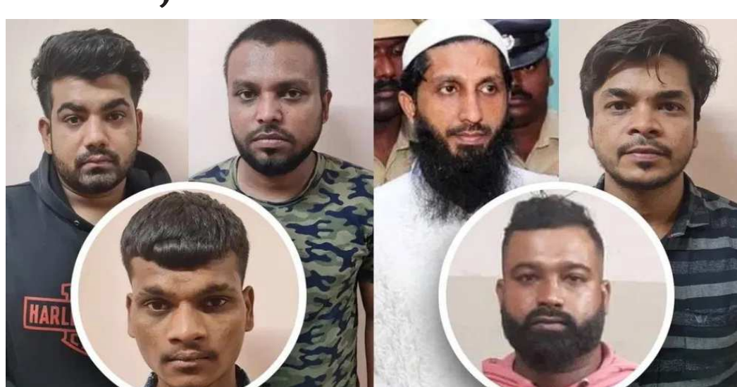
બેંગલુરુ,તા.૧૯ (સીસીબી)એ બેંગલુરુમાંથી પાંચ શંકાસ્પદ આતંકવાદીઓની ધરપકડ કરી છે. આ આતંકવાદીઓ બેંગલુરુમાં સીરિયલ બ્લાસ્ટ