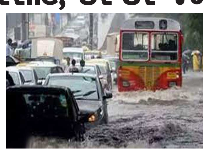
છે અને સતત વરસાદ વરસી રહ્યો છે. દિવસ દરમિયાન હળવાથી ભારે ઝાપટાંના દોર

મુંબઈમાં સતત ધોમધકાર વરસાદ પડી રહ્યો છે અને શહેરના મોટાભાગના વિસ્તારોમાં ચારથી પાંચ ઈંચ પાણી પડી ગયું હતું જોકે, આજે વરસાદનું જોર ઘટ્યા બાદ દિવસભર ઝાપટાં ચાલુ રહ્યાં હતાં. ભારે વરસાદને કારણે શહેરના મુખ્ય માર્ગો પર જળબંબાકારની સ્થિતિને લીધે ઠેર ઠેર ટ્રાફિક જામ જોવા મળ્યો હતો. શહેરમાં છેલ્લા કેટલાક દિવસોથી ચોમાસું સક્રિય બન્યું