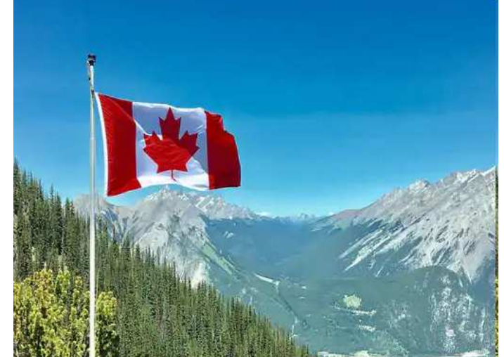
અમેરિકન એચ-૧બી વીઝાધારકો માટે કેનેડાએ મોટી પહેલ કરી છે. હવે ૧૦,૦૦૦ અમેરિકન એચ-૧બી વીઝાધારકોને કેનેડામાં આવીને કામ કરવાની અનુમતિ આપવા માટે એક ઓપન વર્ક પરમિટ સ્ટ્રીમ તૈયાર કરાશે. કેનેડાના ઈમિગ્રેશન મંત્રી સીન ફેઝરે ૨૭ જૂનના રોજ તેની જાહેરાત કરી છે. એક સત્તાવાર પ્રકાશન અનુસાર કેનેડાના શરણાર્થી અને નાગરિકતા મંત્રાલયે કહ્યું કે આ કાર્યક્રમ હેઠળ એચ-૧બી વીઝાધારકોના પરિવારના સભ્યોને પણ વર્ક પરમિટ અપાશે. મંત્રાલયે કહ્યું કે હાઈટેક

અને અમેરિકા બંનેમાં ઓફિસ ધરાવે છે. અમેરિકામાં કામ કરતા લોકો મોટા ભાગે એચ-૧ બી વિઝાનેસ વીઝા રાખે છે. ૧૬ જુલાઈ, ૨૦૨૩ સુધી અમેરિકાના ડેઈ-૧-૨ વિઝાનેસ વીઝાધારકો અને તેમની સાથે આવતા પરિવારના સભ્યો કેનેડા આવવા માટે અરજી કરવાને પાત્ર હશે. ડેઈ-૧-૨ વીઝા વિદેશી નાગરિકોને ટેક સેક્ટર સહિત કેટલાક વિશેષ વ્યવસાયોમાં અસ્થાયી રીતે અમેરિકામાં કામ કરવાની મંજૂરી આપે છે. મહામારી દરમિયાન ટેક કંપનીઓએ ભરતી કરી હતી.