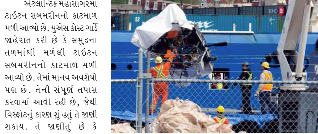
હતી. આ સબમરીનમાં ચાર મુસાફરો અને એક પાયલટ હતા. સબમરીન ગુમ થયા બાદ ૨૬૨

લેવામાં આવ્યો છે. યુએસ કોસ્ટ ગાર્ડ બુધવારે એક સત્તાવાર નિવેદનમાં જણાવ્યું હતું કે સફ હોરાઈઝન આર્કટિક (એક એન્કર હેન્ડલિંગ જહાજ)એ સેન્ટ જોન્સ, ન્યૂફાઉન્ડલેન્ડની નજીક ટાઈટન સબમર્સિબલના સ્થળે સમુદ્રના તળમાંથી સબમરીનનો કાટમાળ અને પુરાવાઓ મેળવ્યા છે. હવે મરીન બોર્ડ ઓફ ઈન્વેસ્ટિગેશન (સી) પુરાવાઓની તપાસ કરશે. કોસ્ટ ગાર્ડ જણાવ્યું હતું કે તબીબી ટીમો કાટમાળમાં રહેલા માનવ અવશેષોનું પણ વિશ્લેષણ કરશે. એમબીઆઈના પ્રમુખ કેપ્ટને જણાવ્યું હતું કે, xઆ મહત્વપૂર્ણ પુરાવાને સુરક્ષિત કરવા અને સાચવવામાં સંકલિત આંતરરાષ્ટ્રીય અને આંતર-એજન્સી સર્પોર્ટ માટે હું આભારી છું. x પુરાવા આપત્તિજનક નુકસાનના કારણોને