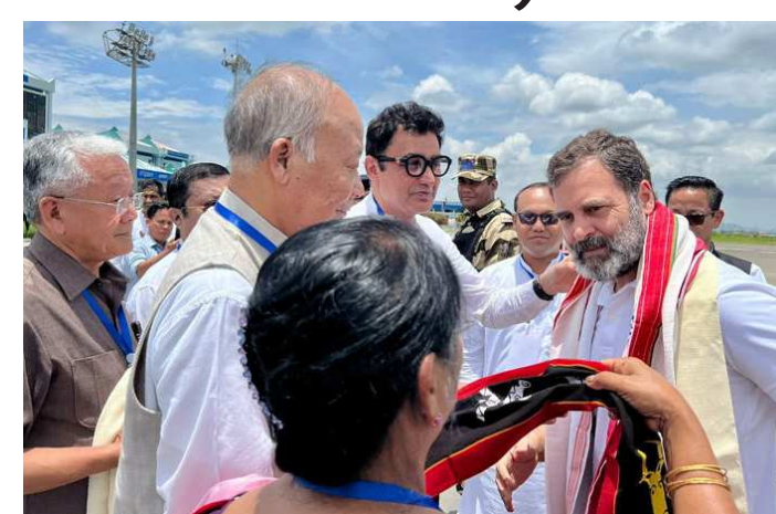
મણિપુર છેલ્લા ૫૮ દિવસથી હિંસાની આગમાં સળગી રહ્યું છે અને આ હિંસામાં ૧૨૦ લોકોએ જીવ ગુમાવ્યા છે. મોટી સંખ્યામાં લોકો ઘાયલ થયા છે. આ પહેલા કેન્દ્રીય ગૃહમંત્રી

કોંગ્રેસ નેતા રાહુલ ગાંધી મણિપુર પહોંચીને હિંસા પીડિતોને મળવા એરપોર્ટથી રવાના થયા હતા ત્યારે માત્ર ૨૦ કિમી જ આગળ વધતા તેમના કાફલાને બિષ્ણુપુર જિલ્લામાં પોલીસે રોકી દીધો હતો. પોલીસે કહ્યું હતું કે આગળ અશાંતિ છે. રાહુલ ગાંધી આજથી મણિપુરના બે દિવસીય પ્રવાસ પર છે. તેઓ આજે સવારે દિલ્હીથી ફ્લાઈટ દ્વારા મણિપુર પહોંચ્યા હતા. રાહુલ ગાંધી આજે અને