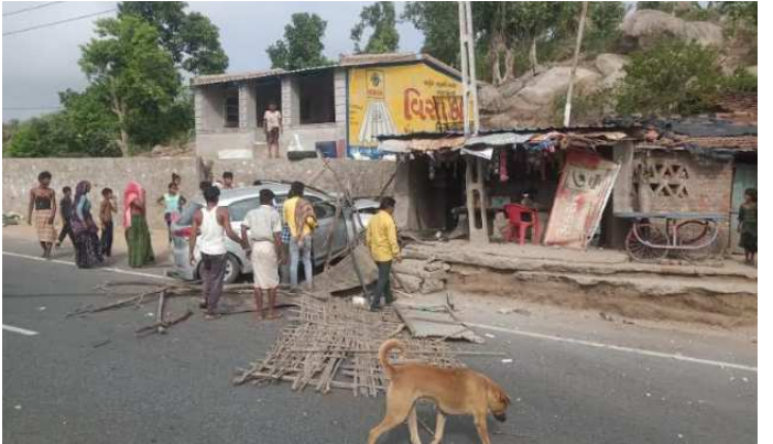
ધાબાવાળી વાવ ગામ પાસે અકસ્માત થયો. દાંતા તરફથી અંબાજી તરફ કાર આવી રહી હતી ત્યારે કાર નુ ટાપર ફાટતા અકસ્માત મહિલા કાર ચલાવતી હોવાની માહિતી સામે આવી. ગરીબ આદિવાસીની દુકાનમાં કાર ઘૂસી ગઈ. સદનસીબે કોઈ જાનહાની નહી. મોટું લાકડું પણ કાર માં ઘૂસી ગયું. મોટી સંખ્યામાં લોકોના ટોળેટોળા એકઠા થયા. ફોરલેવન હાઈવે બન્યા બાદ પણ અકસ્માતો દાંતા તાલુકામાં વધી રહ્યા છે