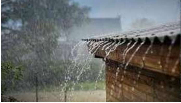
વર્ષ ૨૦૧૮માં ૨૫ જૂને ગુજરાતમાં સરેરાશ ૧૪૬.૧૭ ટકા વરસાદ નોંધાયો હતો. ચોમાસું બેસી ગયું હતું અને

ચાલો જાણીએ, છેલ્લા ૫ વર્ષમાં ક્યારે ચોમાસું બેઠું અને કેટલો વરસાદ થયો? વાત કરીએ વર્ષ ૨૦૧૭ની તો, તે સમયે ૧૨ જૂને ચોમાસું બેસી ગયું હતું અને ગુજરાતમાં ચોમાસાની સિઝનનો સરેરાશ ૧૧૨.૧૮ ટકા વરસાદ નોંધાયો હતો. તેમજ ૨૦૧૮માં ૨૩ જૂને ચોમાસું બેસી ગયું હતું અને ગુજરાતમાં સરેરાશ ૭૬.૭૩ ટકા વરસાદ નોંધાયો હતો હતો.