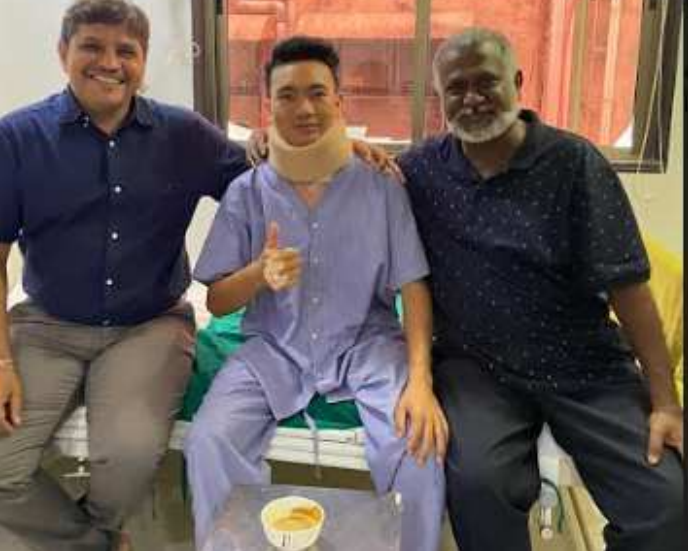
અને દવા પણ લીધી હતી. પરંતુ સારું થયું ન હતું. આ દરમિયાન તેમણે એમઆરઆઈ કરાવ્યું હતું, જેમાં યોથા અને પાંચમા