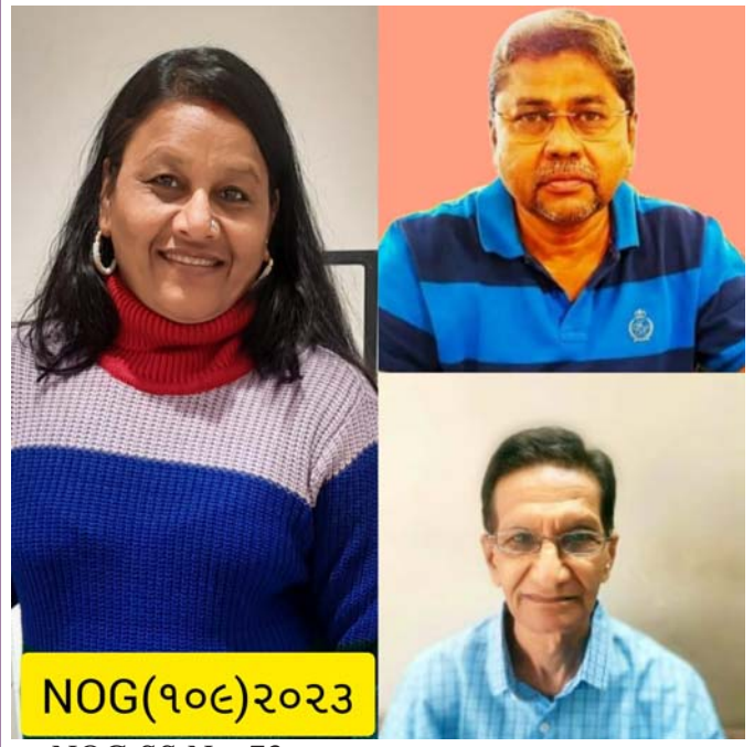
NOG SS No. 73 વિષય : સાકાર નિરાકાર શીર્ષક : ઈશ્વર..

સાકાર અને નિરાકારની વાત કરવાની હોયત્યારે સૌ પ્રથમ ઈશ્વરજી આવે કારણકે ઈશ્વર સાકાર છે, એ દરેક પ્રાણી માત્રમાં ને ઝાડ પાનમાં ને અણુએ અણુમાં સમાયેલો છે, આ આખું જગત સાકાર છે, આ જગતમાં ઈશ્વર હાજરો હાજર સાકાર ને સાક્ષાત છે, તેનું સ્વરૂપ એટલે ચંદ્ર દેવ સુરજ અને પવન દેવ એમના વગર માનવ જીવન જીવવાનું કલ્પના પણ ન કરી શકાય આજનો માનવી ગમે તેટલો આગળ નીકળી જાય તોય સુરજને રોકી શકે, પવનની ગતિને ધીમી કે વધારે ના કરી શકે આ સાકાર સાક્ષાત દેવો છે, છતાં આજનો માનવી મેં કર્યું, મેં કર્યું, ના અહંકાર માં પોતાના સ્વાસ પણ ઉછીના છે એ ભૂલી જાય છે, નિરાકાર તો એ માનવી છે જે ઈશ્વરીય શક્તિનો પરિચય કરવાજ નથી માંગતી, આધુનિકતા માં અટવાયેલો માણસ એટલો બધો લાચાર બની ગયો છે કે હવે તેને ટેકનોલોજી અને આધુનિકતા વગર ચાલતું નથી, એ કુદરતની કરામત અને એની સુંદરતા જોવાનું ભૂલી ગયો છે, પહેલાના જમાનામાં માણસ જમીનને અડીને રહેતો હતો, જમીનમાં માનતો હતો એ ઈશ્વરના સાકાર સ્વરૂપને સમજતો હતો એટલેજ એ ક્યારેય હતાશા માં નહોતો રહેતો, જ્યારે આજનો માનવી ઈશ્વર થી પણ આગળ નીકળવાની હોડમાં પોતાને મળેલું જીવન પણ માણી નથી શકતો એટલેજ આજનો માનવી હતાશા નિરાશા અને એકલાતામાં જીવે છે,