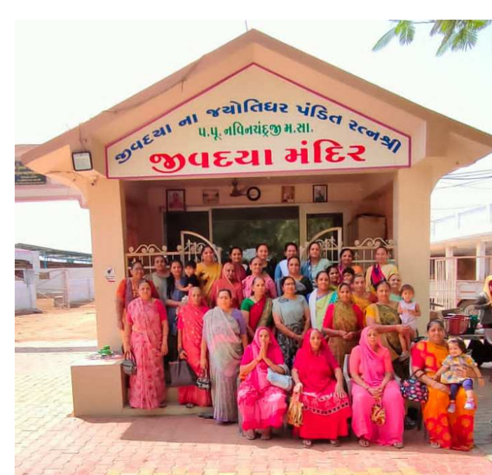
પાળીયાદ, પાળીયાદ મહાજન પાંજરાપોળ ના પટાંગણમાં હરિકૃષ્ણ મહિલા સત્સંગ મંડળ