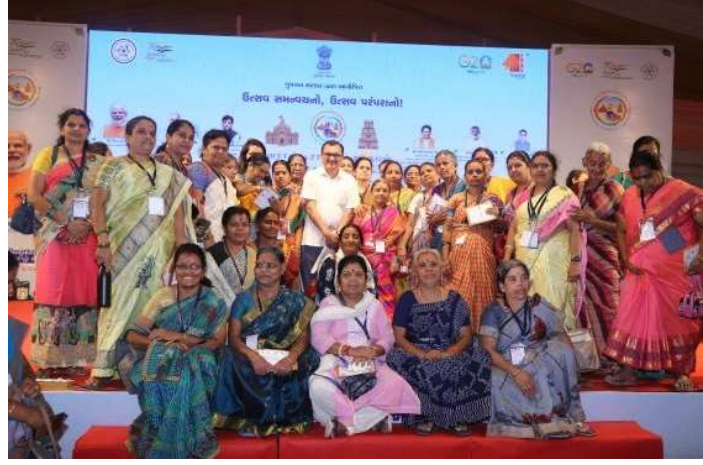
વર્ષ ૨૦૨૩માં ભારત સરકારશ્રીનાં એક ભારત શ્રેષ્ઠ ભારત કાર્યક્રમનો ઉદ્દેશ્ય બે રાજ્યોનાં લોકો વચ્ચે ભાષા શિક્ષણ, સંસ્કૃતિ, પરંપરાઓ અને સંગીત, પર્યટન અને ભોજન, રમતગમત અને શ્રેષ્ઠ પ્રથાઓની વહેંચણી વગેરે ક્ષેત્રોમાં સતત અને

માળખાગત સાંસ્કૃતિક જોડાણને પ્રોત્સાહન આપવાનો છે. જે અંતર્ગત ગુજરાત રાજ્યનાં સૌરાષ્ટ્રના લોકો અને વર્ષો અગાઉ વિદેશી આક્રમણને લીધે સૌરાષ્ટ્રમાંથી સ્થળાંતર કરીને તમિલનાડુમાં સ્થાયી થયેલા સૌરાષ્ટ્રના લોકોને તેમના મૂળ સંસ્કૃતિ સાથે ફરીથી જોડવાના ભાગરૂપે ગુજરાત સરકારશ્રી દ્વારા તા. ૧૭/૦૪/૨૦૨૩ થી તા. ૩૦/૦૪/૨૦૨૩ રાજ્ય કક્ષાના કાર્યક્રમ યોજાયેલ હતો. ઉક્ત કાર્યક્રમમાં ગુજરાત રાજ્યનાં શિક્ષણ વિભાગનાં માર્ગદર્શન હેઠળ તા. ૧૮/૦૪/૨૦૨૩ થી ૨૮/૦૪/