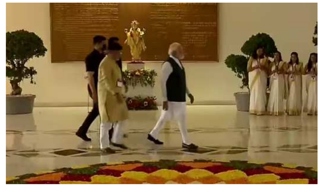
મંગળવારે કેરળની પ્રથમ વંદે ભારત ટ્રેનને લીલી ઝંડી બતાવી હતી. તેઓ સવારે ૧૧ વાગ્યે તિરુવનંતપુરમ સેન્ટ્રલ સ્ટેશન પહોંચ્યા અને તિરુવનંતપુરમ-કસારગોડ વચ્ચે વંદે ભારત એક્સપ્રેસ ટ્રેનને રવાના કરાવી હતી. બાદમાં વડાપ્રધાન નરેન્દ્ર મોદીએ તિરુવનંતપુરમમાં દેશના પ્રથમ ડિજિટલ સાયન્સ પાર્કનો શિલાન્યાસ કર્યો હતો. આ પ્રોજેક્ટનો કુલ ખર્ચ ૧૫૧૫ કરોડ છે. પ્રથમ તબક્કામાં ૨૦૦ કરોડ ખર્ચવામાં આવશે. આ સિવાય પીએમએ દેશની પ્રથમ વોટર મેટ્રો સેવાનું પણ ઉદ્ઘાટન કર્યું હતું. પોર્ટ સિટી કોચીમાં બનેલ મેટ્રો કોચી શહેરને નજીકના ૧૦ ટાપુઓ સાથે જોડશે. કેરળના મુખ્યમંત્રી પિનારાઈ વિજયને કહ્યું હતું, 'વિશ્વકક્ષાની કોચી વોટર મેટ્રો એની યાત્રા માટે તૈયાર છે. એ કોચી અને એની આસપાસના ૧૦ ટાપુને જોડવાનો કેરળનો ડ્રીમ પ્રોજેક્ટ છે.

એક મેડિકલ કોલેજ નહોતી બની' ૨૦૧૪માં તમે અમને સેવાનો અવસર આપ્યો તો અમે તમારી સેવાની ભાવનાથી કામ કરવાનું શરૂ કર્યું. તેનું પરિણામ છે કે, દમણ, દીવ, દાદરા અને નગર હવેલીને તેની પ્રથમ નમો મેડિકલ કોલેજ મળી 'આવનારા સમયમાં સેલવાસ અને આસપાસનો વિસ્તાર સ્વાસ્થ્ય સુવિધાને લઈ બહુ મજબૂત થવાનો છે' વડાપ્રધાને કહ્યું હતું કે હવે ગરીબ માતાનો દીકરો પણ ડોક્ટર બનવાનું સપનું સેવી શકે છે અમારી સરકારે દેશના ૩ કરોડથી વધુ ગરીબ પરિવારનો પાકું ધર બનાવીને આપ્યું ' અમારી સરકારે અહીં સંઘપ્રદેશની હજારો મહિલાઓને પોતાના ઘરના માલિક બનાવવાનું કામ કર્યું છે 'હવે તો મન કી બાતની આગામી રવિવારે સેન્યુરી થવાની છે. તમારી સાથે મને પણ ૧૦૦માં એપિસોડનો ઈતિહાસ છે ' વડાપ્રધાન નરેન્દ્ર મોદીએ