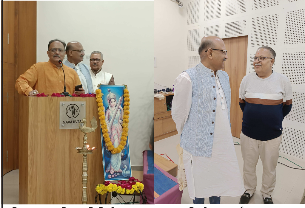
વિશ્વ પુસ્તક દિવસ નિમિત્તે ખાસ ૧૬ પુસ્તક વિમોચન કાર્યક્રમ માં ખાસ મુલાકાતો.

જ્ઞાન લઈને જોનાથન એક દિવસ પોતાનાં કબીલામાં પાછો ફરીને પોતાની જેમ જ નાત બહાર મુકાયેલાં સ્વપ્નેની સાગરપંખીઓનો ગુરુ બની જાય છે અને તે યુવા સગરપંખીઓનાં હૃદયમાં પણ પોતાનાં સ્વપ્નનું એક બીજ રોપી દે છે. આમ, નિજ સ્વપ્ને લાખ વિષમતાઓ વચ્ચે પણ છોડી ન દેવું તે પ્રેરણા વાચકના મનમાં છલોછલ ભરી દેતો આ પુસ્તકમાં વાર્તાનાં અંતમાં જોનાથન મરતો નથી પણ વિલિન થાય છે મારામાં, તમારામાં, જેઓ સપનાંઓ સેવે છે અને અને તેને સાર્થક કરવા મરણિયા બની જાય છે - દુનિયાની પરવા કર્યા વગર - તે સહુમાં.