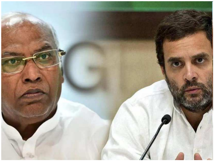
કોંગ્રેસના રાષ્ટ્રીય મલ્લિકાર્જુન ખડગેએ કોર્ટના નિર્ણય પર પ્રતિક્રિયા આપતા કહ્યું કે તેમને જામીન મળી ગયા છે. અમે શરૂઆતથી જ જાણીએ છીએ કે

નવીદિલ્હી, તા. ૨૩ ગુજરાતના સુરતની એક અદાલતે ૨૦૧૯માં કોંગ્રેસ સાંસદ રાહુલ ગાંધી દ્વારા મોદી અટક અંગે આપેલી ટિપ્પણી પર પોતાનો ચુકાદો આપ્યો હતો. કોર્ટે તેને આ કેસમાં દોષિત ઠેરવી બે વર્ષની જેલની સજા ફટકારી હતી. જો કે આ કેસમાં તેને તરત જ જામીન મળી ગયા હતા. આ સાથે જ રાહુલ અને અન્ય વિપક્ષી નેતાઓની પ્રતિક્રિયા પણ સામે આવી છે. મહાત્મા ગાંધીને ટાંકીને રાહુલ ગાંધીએ લખ્યું, મારો ધર્મ સત્ય અને અહિંસા પર આધારિત છે. સત્ય મારા ભગવાન છે, અહિંસા તેને મેળવવાનું સાધન