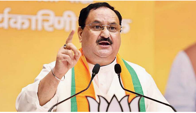
નવીદિલ્હી,તા.૧૮ આ યાદી સાથે, ભાજપે અત્યાર ભાજપે ૧૦ વધુ સુધીમાં તેના કુલ ૨૨૨ ઉમેદવારોના નામની જાહેરાતની સાથે કર્ણાટક વિધાનસભાની ચૂંટણી માટે તેની ત્રીજી યાદી પણ બહાર પાડી છે. ૧૦ ઉમેદવારોની

ભાજપ દ્વારા અત્યાર સુધી જેઓને ટિકિટ આપવામાં આવી છે તેવા પક્ષના મજબૂત નેતાઓના ભાઈ-ભત્રીજાઓ સામેલ