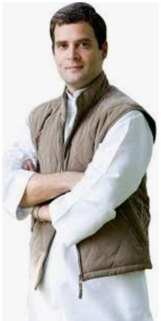
ગીટીને આટલું બધું મહત્વ આપવાની કોઈ જરૂર જ નથી.

આવી જ રીતે સરકાર અને ટેલિફોન કંપની બધા જ ભૂતપૂર્વ સાંસદોને અને મતીઓને અપાયેલા બંગલા ખાલી કરાવે. બી.એસ.એન.એલ.એ તાકાલિક આ લોકોના સરકારી કનેક્શન બંધ કરે તો આપણા ભારતીયોના મહેનતના કરવેરાના કરોડો રૂપિયા બચી જાય. મોટી અને ભાજપનું કદ હવે રાહુલ અને કોંગ્રેસ કરતા અનેક ઘણું વધી ગયું છે. હવે રાહુલને રોજ