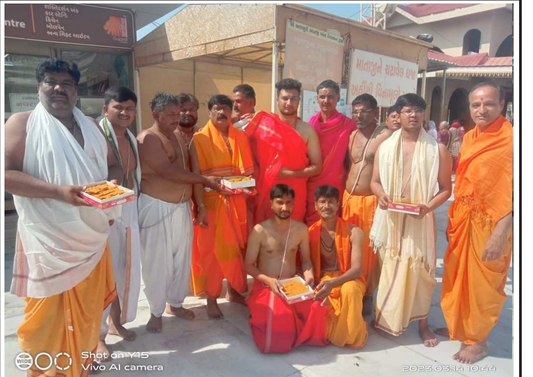
આજરોજ સમસ્ત બ્રહ્મ સમાજ સંગઠન કલલાલ શહેર/તાલુકા દ્વારા આરાસુરી માં અંબાજીના ૪૩૨ વર્ષ જૂની પરંપરા ના ટુટે તે અનુસંધાને ભૂદેવો દ્વારા ૫૧ કિલો મોહનથાળ (રાજભોગ) માતાજીના ચરણોમાં અર્પિત કરી ધન્યતા અનુભવી અને મા અંબાના ચાયર ચોકમાં ભક્તજનોને નિશુલ્ક મોહનથાળ નું વિતરણ કર્યું. બોલ માડી અંબે જય જય અંબે.....

પરીક્ષા શરૂ થતાની સાથે જ આજે સવારે પરીક્ષા કેન્દ્રો પર વિદ્યાર્થીઓ અને વાલીઓના ટોળા જોવા મળ્યા હતા. પરીક્ષા શરૂ થયા બાદ પણ આકરા તાપમાં મોટાભાગના વાલીઓ પરીક્ષા કેન્દ્રની બહાર પેપર પુરૂ થાય તેની રાહ જોતા નજરે પડ્યા હતા.જયારે વાલીઓ પોતાના વિદ્યાર્થીઓને શાંતિપૂર્ણ અને ગભરાયા વિના પેપર લખવાની સૂચના આપતા નજરે પડી રહ્યાં હતાં જો કે ધો. ૧૦ અને ધો. ૧૨ના પ્રથમ દિવસની પરીક્ષાના પેપર સહેલા હોવાથી વાલીઓ અને વિદ્યાર્થીઓ ખુશ નજરે પડ્યા હતાં અને આશી વ્યક્ત કરી હતી કે આગામી પેપરો પણ સહેલા પુણવમાં આવશે