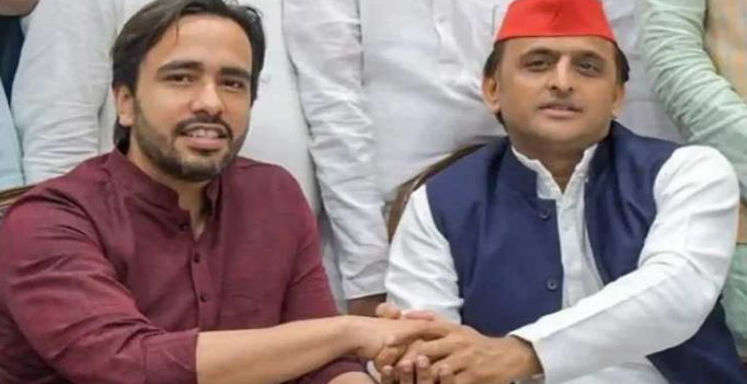
આવી સ્થિતિમાં ભાજપ માટે આ બેઠકો જીતવા મુશ્કેલ બની જશે

લખનૌ, તા. ૧૦ યુપીના રાજકારણમાં સપાના રાષ્ટ્રીય અધ્યક્ષ અભિલેશ યાદવની ૮૦ બેઠકો પર લોકસભા ચૂંટણી લડવાની ફોર્મ્યુલાએ પશ્ચિમમાં રાજકીય હલચલ તેજ કરી દીધી છે. અભિલેશ યાદવની જાહેરાત બાદ જયંત ચૌધરીની પાર્ટી ચૂંટણીને લઈને વધુ સક્રિય થઈ ગઈ છે. પાર્ટીમાં એવા નેતાઓના કદ, અસ્તિત્વ અને પ્રભાવની શોધ કરવામાં આવી રહી છે. અભિલેશ જે ૮૦ સીટો પર