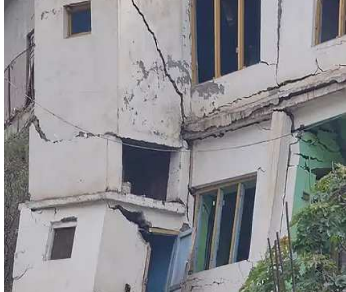
જમ્મુ, તા. ૪ જમ્મુ - કાશ્મીરમાં ઉત્તરાખંડના જોશીમઠ જેવી દુર્ઘટના બની છે. જમ્મુના ડોડામાં જમીન ધસી જવાને કારણે ૨૧ મકાનોમાં તિરાડો પડી ગઈ છે. માહિતી મળતાં પહોંચેલા ધારણીના એસડીએમ આપત્તિથી પ્રભાવિત લોકોને સુરક્ષિત સ્થળે લઈ ગયા. જિયોલોજિકલ સર્વે ઓફ ઈન્ડિયાની ટીમ પણ ઘટનાના કારણની તપાસ કરવા પહોંચી ગઈ છે. ડોડાના જિલ્લા મેજિસ્ટ્રેટ અતહર અમીને જણાવ્યું હતું કે ડિસેમ્બરમાં જિલ્લામાં કેટલાંક ઘરોમાં તિરાડો પડી હતી. ગુરુવાર સુધીમાં, વધુ

છ ઈમારતોમાં તિરાડો પડી ગઈ છે. તિરાડો વધી રહી છે. આ અંગે સરકારને જાણ કરવામાં આવી છે. ડિસેમ્બર ૨૭: જોશીમઠનાં મકાનોમાં તિરાડો દેખાયા પછી લોકોએ આંદોલનની ચેતવણી આપી. આ પછી, વહીવટીતંત્રના એન્જિનિયરો અને અધિકારીઓની ૫ સભ્યોની ટીમે તિરાડોની તપાસ કરી. બાદમાં જોશીમઠનાં ઘરોમાં તિરાડો વધતી રહી, જ્યારે સ્થિતિ વધુ વણસી ત્યારે રાજ્ય અને કેન્દ્ર સરકારે તેની નોંધ લીધી. ૬ જાન્યુઆરી: લગભગ ૫૦૦ મકાનો અને ઈમારતોમાં તિરાડો દેખાતા ભય વધી ગયો. અસરગ્રસ્ત મકાનોમાં રહેતા લોકોને સલામત સ્થળે ખસેડવાની કામગીરી ઝડપી કરવામાં આવી હતી. જોશીમઠમાં મકાનોમાં તિરાડો દેખાયા બાદ હવે સ્થળાંતરનું કામ શરૂ કરવામાં આવ્યું છે. ૭ જાન્યુઆરી: ઉત્તરાખંડના સીએમ પુષ્કર સિંહ ધામી પરિસ્થિતિનો તાગ મેળવવા જોશીમઠ પહોંચ્યા. આ દરમિયાન, ચમોલીના ડીએમ હિમાંશુ ખુરાનાએ જણાવ્યું કે સમસ્યા માત્ર અમુક વિસ્તારોમાં જ છે. સીએમએ અસરગ્રસ્ત લોકોને શક્ય તમામ મદદ આપવાના નિર્દેશ આપ્યા હતા. ૮ જાન્યુઆરી: વડાપ્રધાન કાર્યાલય (ઈ)એ જોશીમઠમાં પરિસ્થિતિ અંગે ઉચ્ચ સ્તરીય બેઠક યોજી. જિલ્લા વહીવટી તંત્ર દ્વારા લોકોને વહેલી તકે સલામત સ્થળે ખસેડવા માટે કહેવામાં આવ્યું છે. પીએમ મોદીએ આ મુદ્દે રાજ્યના સીએમ ધામી સાથે વાત કરી હતી. ૯ જાન્યુઆરી: કેન્દ્રની એક ટીમ જોશીમઠમાં ઈમારતોને થયેલા નુકસાનની સમીક્ષા કરવા સાંજે આવી. ટીમે તપાસ કરીને રિપોર્ટ રાજ્ય સરકારને સુપરત કર્યો હતો. ૪૭૮ મકાનો અને ૨ હોટલને ૩-૪ જોન તરીકે જાહેર કરવામાં આવ્યાં છે. જ્યારે, ઉત્તરાખંડ સરકારે જોશીમઠને ત્રણ જોનમાં વહેંચવાનો