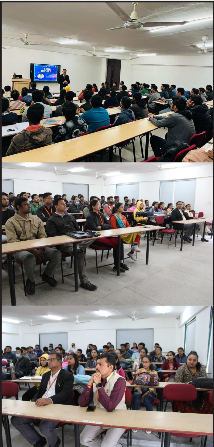
Session on Union Budget-2023 at Rai University

ધનલોભી ધનનંદનને રૂક જાવ હેલવું પડશે! બિલાડીને ગળે ઘંટ કોણ બાંધશે? ભરત વૈષ્ણવ ૦૧.૦૨.૨૦૨૩.# હાસ્ય