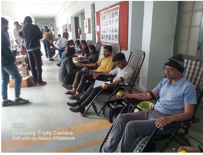
નાગરિકોનું નિર્માણ કરનાર અને વિદ્યાલયમાં રક્તદાન મહાદાનની ભાવના સાથે સમાજ સેવાના અવિરત કાર્ય કરતી સર્વ

‘કર ભલા હોગા ભલા’ અને ‘શિક્ષણ એ જ સાચી સેવા’નાં અભિગમ તથા શિક્ષણ સાથે સામાજિક ઉત્થાનનું કાર્ય કરતી સર્વ વિદ્યાલય કેમ્પસની મંડળના વિકાસમાં જેમનો સિદ્ધાંત રહ્યો છે અને “શિક્ષણ એ જ સાચી સેવા”ના સૂત્રને જીવનમંત્ર બનાવનાર પૂજ્ય માણેકલાલ એમ. પટેલ સાહેબની જન્મ જયંતિ નિમિત્તે સર્વ વિદ્યાલય કેમ્પસ - કડી તથા ગાંધીનગરમાં છેલ્લા ૧૨ વર્ષથી રક્તદાન શિબિરનું આયોજન કરવામાં આવે છે. વિદ્યાર્થી આવૃત્તીકાલનો નાગરિક છે ત્યારે સમાજનાં હિતમાં હરહંમેશ સામાજિક જીવનમાં સારા