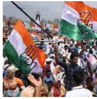
અમદાવાદ, તા. ૪

ગુજરાત વિધાનસભાની ચૂંટણીમાં ભાજપે આ વખતે પૂર્વ મુખ્યમંત્રી માધવસિંહ સોલંકીનો રેકોર્ડ તોડી નાંખ્યો છે. ભાજપે આ વખતે ૧૫૭ બેઠકો જીતીને એક નવો ઇતિહાસ સ્થાપિત કર્યો છે. ત્યારે કોંગ્રેસનો આ વખતનો પરાજય સૌથી ખરાબ પરાજય ગણાયો છે. જે કોંગ્રેસ છેલ્લા ૨૭ વર્ષથી પૃથ્વી વધુ બેઠકો પર જીત મેળવતી હતી. તે કોંગ્રેસ ૨૦૧૭માં ૮૦ બેઠકો સુધી પહોંચી ગઈ હતી. પરંતુ આ વખતે કોંગ્રેસની માત્ર ૧૭ બેઠકો આવતાં જ હાઈકમાન્ડ ખૂબજ નારાજ થયો છે. આ વખતના પરિણામોને લઈને કોંગ્રેસ દ્વારા મંથન કરવામાં આવશે. આ માટે કોંગ્રેસે ૩ સભ્યોની સત્ય શોધક સમિતીનું ગઠન કર્યું છે. તે ઉપરાંત આ કમિટી ચૂંટણીના પરિણામોના કારણોની સાતત્યતા પણ ચકાસશે. કોંગ્રેસના રાષ્ટ્રીય પ્રમુખ મલ્લાજીન પડગેએ ગુજરાતના પરાજય બાદ સત્ય શોધક કમિટીની રચના કરી છે. જેમાં ત્રણ સભ્યોની