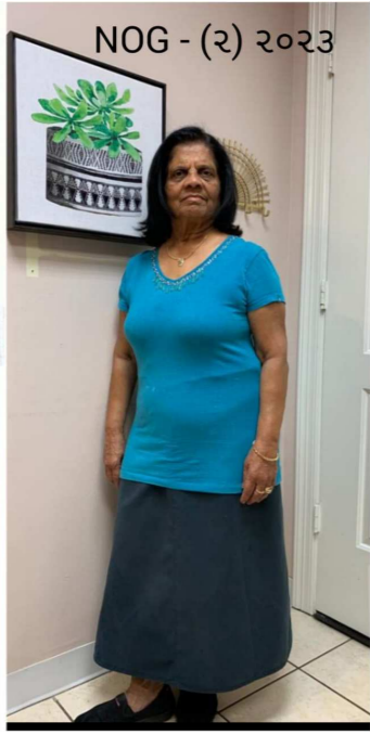
NOG - (૨) ૨૦૨૩