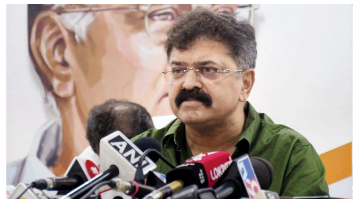
તુળજાપુર લઈ જવાયા હતા. પ્રેમ ઊભરાઈ રહ્યો છે? જે ઔરંગઝેબે છત્રપતિ શિવાજી મહારાજને પરેશાન કર્યા, મહારાજાને અનેક મંદિરો તોડ્યાં, ઈતિહાસ વિવાદ જગાવે છે.'

મુંબઈ,તા.૪ મહાપુરુષોના અપમાન બાબતે સત્તાધારી અને વિરોધ પક્ષો વચ્ચે છેલ્લા કેટલાક સમયથી નિવેદનબાજ ચાલી રહી છે ત્યારે હવે આમાં મોગલ સમ્રાટ ઔરંગઝેબના મુદ્દે રાજકારણ ગરમાઈ ગયું છે.