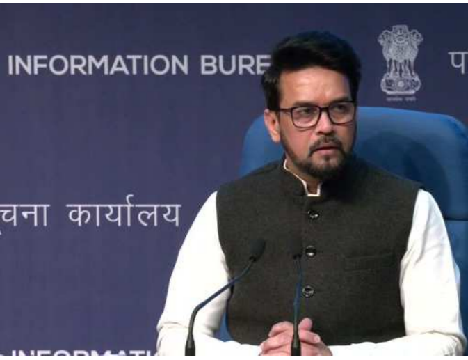
નવીદિલ્હી,તા.૪ આજે બુધવાર જાન્યુઆરીના રોજ વડાપ્રધાન મોદીના નેતૃત્વમાં મળેલી કેબિનેટની બેઠકમાં

મહત્વના નિર્ણયો લેવામાં આવ્યા છે. કેન્દ્રીય મંત્રી અનુરાગ ઠાકુરે જણાવ્યું કે નેશનલ ગ્રીન હાઇડ્રોજન મિશનને કેન્દ્રીય કેબિનેટ દ્વારા મંજૂરી આપવામાં આવી છે. આ સાથે તેમણે માહિતી આપી હતી કે ભારત ગ્રીન હાઇડ્રોજનનું વૈશ્વિક હબ બનશે. દર વર્ષે ૫૦ લાખ ટન ગ્રીન હાઇડ્રોજનનું ઉત્પાદન થશે. કેન્દ્રીય મંત્રી અનુરાગ ઠાકુરે આજે માહિતી આપતાં જણાવ્યું હતું કે વડાપ્રધાન મોદીના નેતૃત્વમાં કેબિનેટની બેઠકમાં મહત્વના નિર્ણયો લેવામાં આવ્યા છે. આજે કેન્દ્રીય કેબિનેટે નેશનલ ગ્રીન હાઇડ્રોજન મિશનને મંજૂરી આપી છે. ભારત ગ્રીન હાઇડ્રોજનનું વૈશ્વિક હબ બનશે. વાર્ષિક ૫૦ લાખ ટન ગ્રીન હાઇડ્રોજનનું ઉત્પાદન થશે. કેન્દ્રીય મંત્રી અનુરાગ ઠાકુરે જણાવ્યું કે ૬૦-૧૦૦ ગીગાવોટની ક્ષમતાનું ઈલેક્ટ્રોલાઇઝર તૈયાર કરવામાં આવશે. ઈલેક્ટ્રોલાઇઝરના ઉત્પાદન પર ૧૭,૪૮૦ કરોડની પ્રોત્સાહક રકમ આપવામાં આવશે. ગ્રીન હાઇડ્રોજનનું હબ વિકસાવવા માટે ૪૦૦ કરોડની જોગવાઈ કરવામાં આવી છે. કેન્દ્રીય મંત્રી અનુરાગ ઠાકુરે કહ્યું કે નેશનલ ગ્રીન હાઇડ્રોજન મિશન માટે આજે ૧૮,૭૪૪ કરોડ રૂપિયા મંજૂર કરવામાં આવ્યા છે. આ મિશનથી ૮ લાખ કરોડ રૂપિયાનું સીધું રોકાણ થશે અને તેના દ્વારા ૬ લાખ નોકરીઓ આપવામાં આવશે. આ સિવાય તેમણે કહ્યું કે હિમાચલ પ્રદેશ માટે ૩૮૨ મેગાવોટ સુન્ની ઝેમ હાઇડ્રોઇલેક્ટ્રિક પાવર પ્રોજેક્ટને મંજૂરી આપવામાં આવી છે. ૨,૬૧૪ કરોડનો ખર્ચ થશે. અને આ યોજના સતલુજ નદી પર બનાવવામાં આવશે. ગ્રીન હાઇડ્રોજન એક પ્રકારની સ્વચ્છ