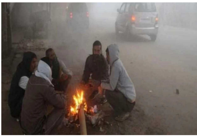
જગ્યાએ પાણી જામી ચૂક્યું છે. ખાનગી હવામાન એજન્સી સ્કાઈમેટ અને ઉત્તર રાજસ્થાનના સાથે હરિયાણા, ઉત્તર રાજસ્થાન, બિહાર, ઉત્તર પ્રદેશ અને દિલ્હીના અમુક ભાગોમાં ગાઢ ધૂમ્મસ છવાઈ શકે છે. હવામાન સૂકુ રહેશે. માત્ર તટીય અંધ પંજાબ, હરિયાણા અને ઉત્તર રાજસ્થાનના અમુક ભાગોમાં

કડાકાની ઠંડી પડી રહી છે. કાશ્મીરમાં કોલવેવ વધુ તીવ્ર બની ગયું છે. જ્યારે શ્રીનગરમાં પારો શૂન્યથી પાંચ ડિગ્રી વધુ નીચે ગગડી ગયો છે. ગુલમર્ગ અને પહેલગામાં અત્યાર સુધીનું સૌથી ઓછું તાપમાન નોંધવામાં આવ્યું છે. હવામાન વિભાગે આગલા થોડા દિવસો સુધી ગિલગિટ-બાલ્ટિસ્તાન, મુઝફ્ફરબાદ, લદાખ, જમ્મુ-કાશ્મીર, હિમાચલ પ્રદેશ અને ઉત્તરાખંડના પહાડો પર હિમવર્ષા સાથે વરસાદ ચાલુ રહેવાની સંભાવના વ્યક્ત કરી છે. હિમાલયી વિસ્તારોમાં છેલ્લા ઘણા દિવસોથી ચાલી રહેલ હિમપાતના કારણે પારો શૂન્યથી નીચે જતો રહ્યો છે. ઘણી