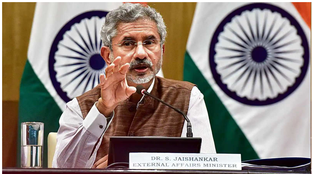
પરિષદની સદસ્યતા વધારવાનો પ્રશ્ન છેલ્લા ત્રણ દાયકાથી યુએનજીએના એજન્ડામાં છે. જ્યાં છે, જ્યારે વાસ્તવિક દુનિયા આ સુધારા પરની ચર્ચા બેકાર બની ગઈ બધાની વચ્ચે તમાસો બની રહી છે.

મંગળવારે બે આતંકવાદ વિરોધી બેઠકોની અધ્યક્ષતા કરવા સંયુક્ત રાષ્ટ્ર પહોંચ્યા હતા. ભારતે ૧ ડિસેમ્બરના રોજ સુરક્ષા પરિષદનું એક બાદ એક ફરતી માસિક અધ્યક્ષતા સંભાળી હતી. ઓગસ્ટ ૨૦૨૧ પછી આ બીજી વખત છે, જ્યારે ભારત દ્રઝજી સભ્ય તરીકે તેના બે વર્ષના કાર્યકાળ દરમિયાન કાઉન્સિલની અધ્યક્ષતા કરી રહ્યું છે. જયશંકરે કહ્યું કે સુધારા એ સમયની જરૂરિયાત છે. મને વિશ્વાસ છે કે ગ્લોબલ સાઉથ ખાસ કરીને ભારતના દ્રઢ નિશ્ચયને શેર કરે છે. આપણે બધા જાણીએ છીએ કે સમાન પ્રતિનિધિત્વ અને સુરક્ષા