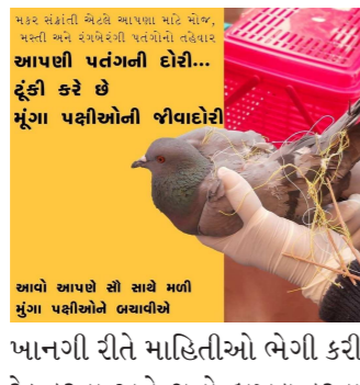
આવો ભાવે સૌ સાથે મળી મુગા પક્ષીઓને લાભવશે