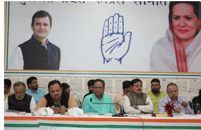
પ્રચંડ બેરોજગારી અને મોંઘવારી, નફરત અને વિભાજનની રાજનીતિ અને આપણી રાજકીય વ્યવસ્થાના અતિશય કેન્દ્રીકરણને સંબોધવા માંગે છે જીવનના તમામ ક્ષેત્રના લોકો આ ઐતિહાસિક ચળવળનો ભાગ બનવા માટે એકઠા થઈ રહ્યા છે.

આજે આ યાત્રા ૧૦૪ દિવસ અવિરત રોજના ૨૫ કિ.મી. ચાલીને આપણા રાષ્ટ્રને વિભાજિત કરી રહેલા આર્થિક, સામાજિક અને રાજકીય મુદ્દાઓ સામે અવાજ ઉઠાવી રહી છે અને કોંગ્રેસના નેતાઓની સાથે લાખો લોકો આંદોલનમાં જોડાયા છે. આ યાત્રા